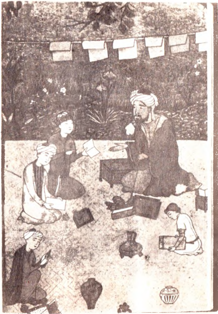
Дори альбомидан. Мактабда ўқитиш. Рассом Бехзод (15-аср).