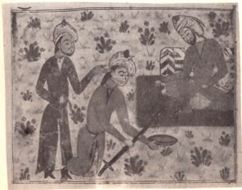
Амир Хисрав Дехлавий. «Хамса». Искандар Турк хоконининг элчисини кабу килмокда (14-аср миниатюраси).