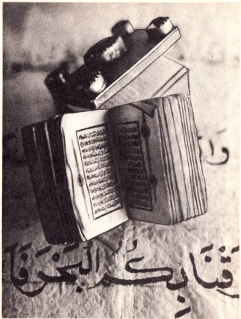
Чўнтакда олиб юриладиган митти қуръон.