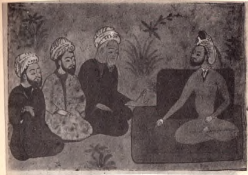
Амир Хисрав Дехлавий. «Хамса». Искандар донишмандлар билан. 1362 й.