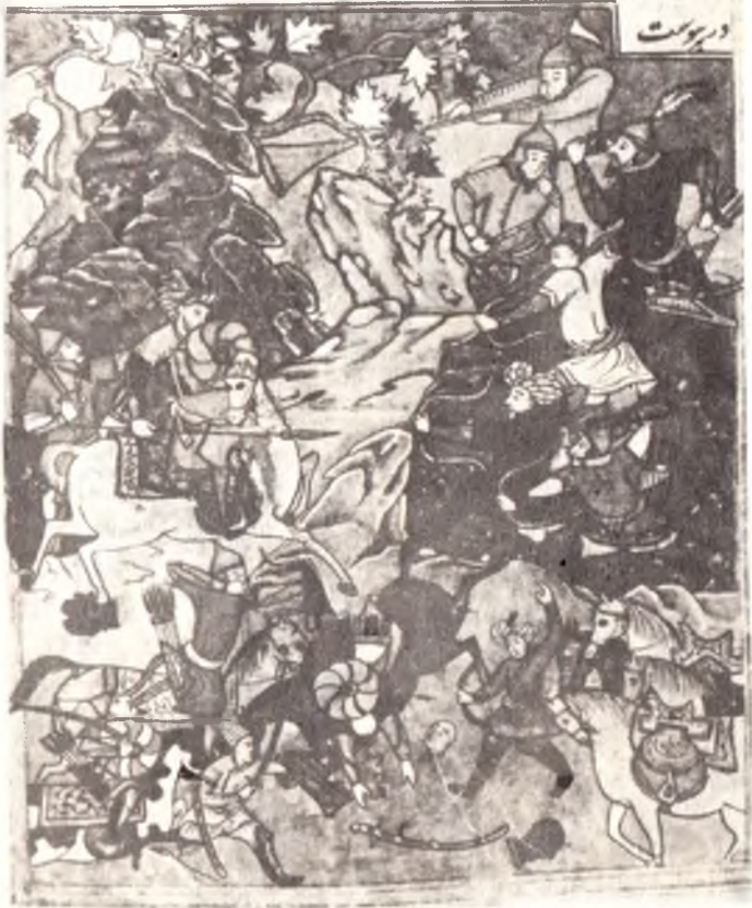
Дарё буйидаги жанг.