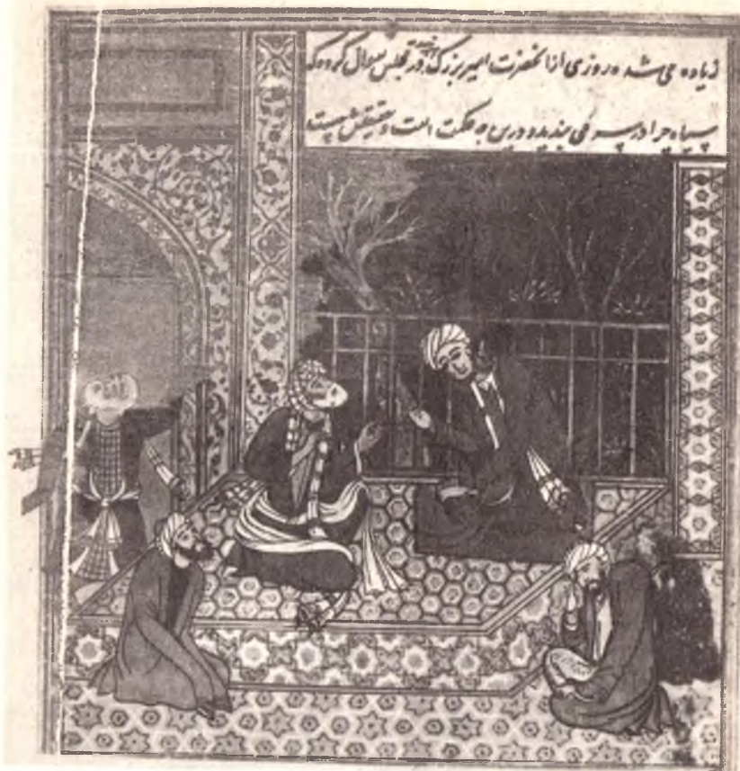
Темурнинг диний мубоҳасада энгиши .