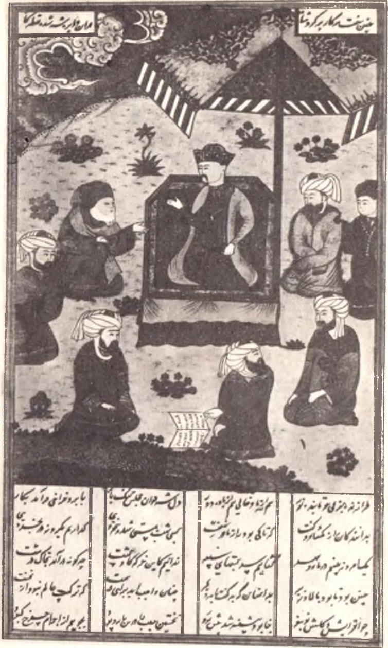
Низомий. «Хамса». Искандарнинг етти донишманд билан суҳбати. 15-аср.