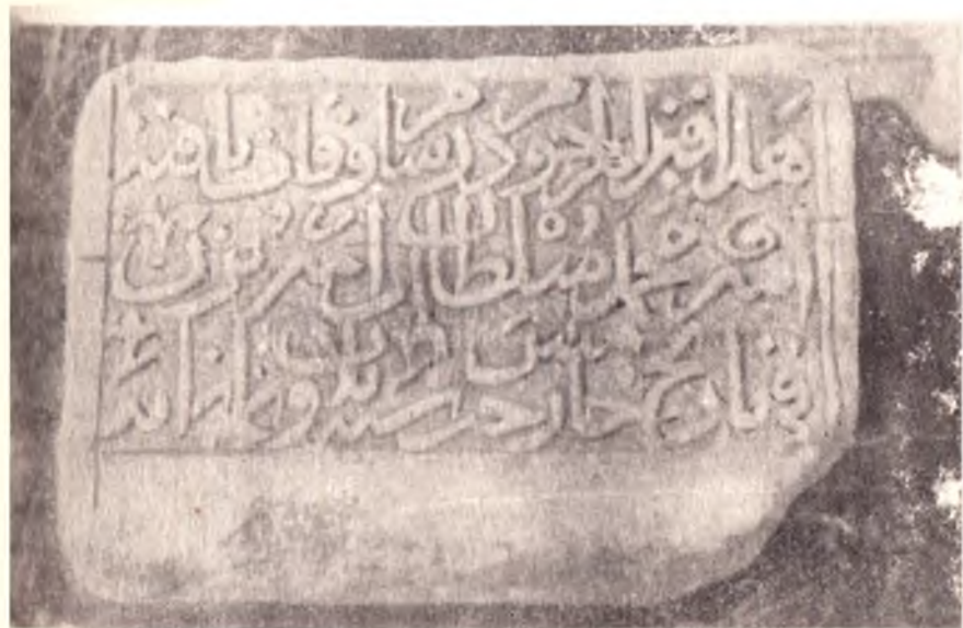
Темурнинг набираси Муҳаммад Султон кабрига вақтинчалик қўйилган ёдгорлик. Самарқанд, Боғи-Султони.