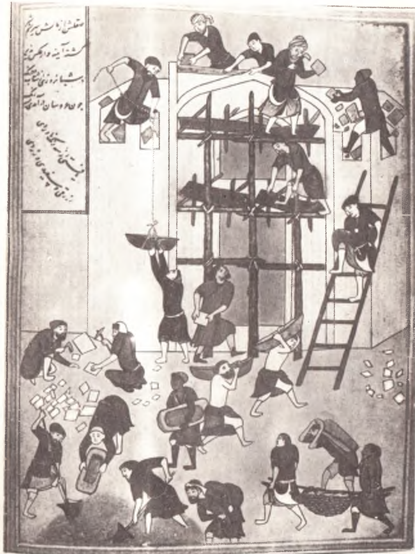
Низомий. «Хамса» Хаварнок қасрининг қурилиши. Рассом Бехзод (1495 й.)