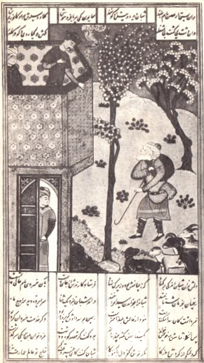
Низомий. «Хамса». Искандарнинг чўпон билан суҳбати (1491 й.)