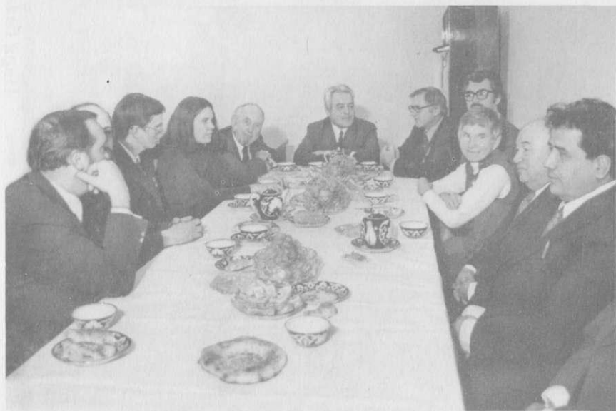
Тарих институтида чет эллик олимлар билан учрашув (1978 йил).