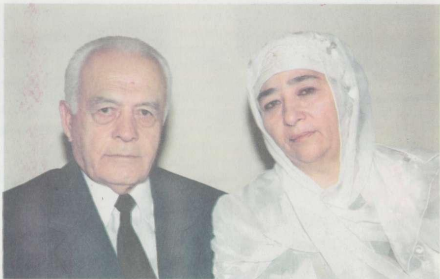
Ярим асрдан буён ёнма-ён.