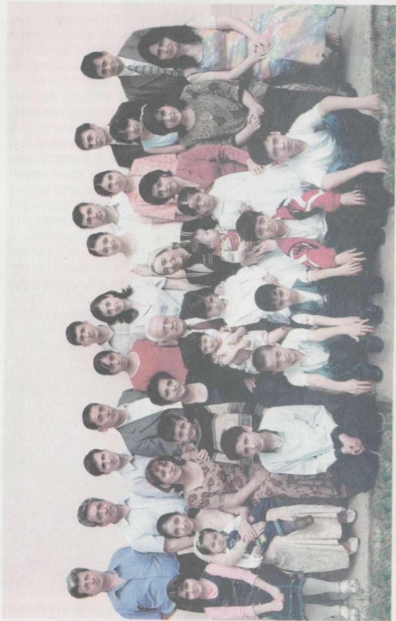
Пири бадавлаг оила.