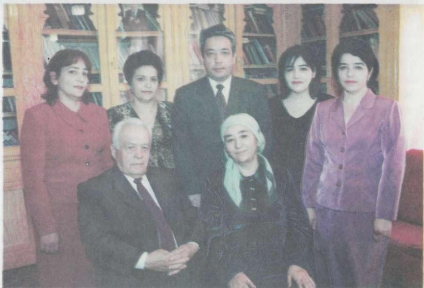
Ўғил-қизлар камоли — ота-она бахти.