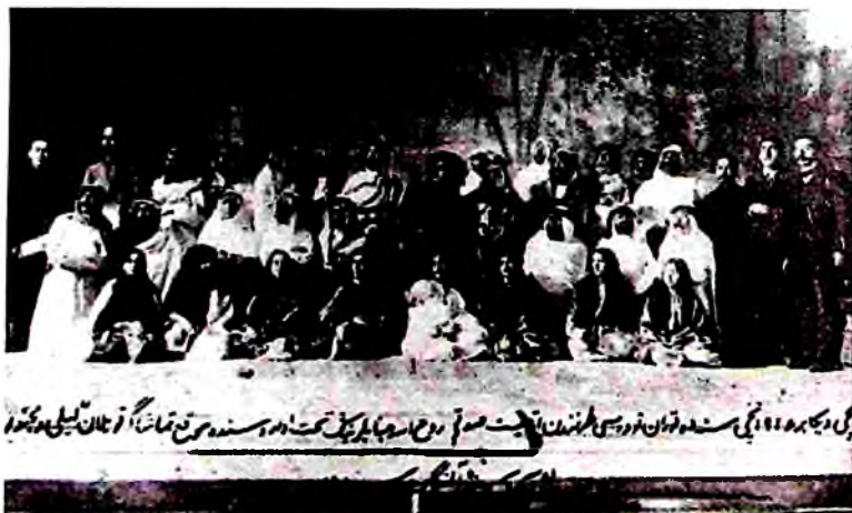
8-расм. “Турон” труппаси томонидан 1914 йилда “Лайли ва Мажнун” спектакли саҳнага қўйилган. Мазкур труппа таркибида 8 нафар татар актрисаси бўлган