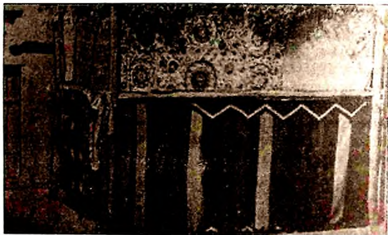
1-расм. Театр сахнасининг дастлабки кўриниши