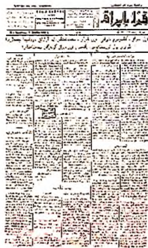
7-а расм. Татар аёллари ўз мақолалари билан мунтазам иштирок этган “Иштирокиюн” (1919–1920), “Қизил Байроқ” (1922) газеталари