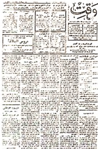
7-расм. Татар аёллари ўз мақолалари билан мунтазам иштирок этган “Садон Туркистон” (1914–1915), “Вақт” (1916–1917) газеталари