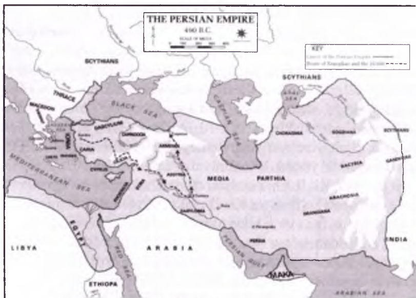
Afg'oniston hududlari Fors imperiyasi tarkibida

Fors imperiyasi yuksalish davrida hozirgi Afg'oniston hududlari Ahamoniylar imperiyasining bir qancha viloyatlarini o'z ichiga olgan. Imperiyaning buyuk hukmdori Kir II mil.avv. 559–530-yillarda hukmronlik qildi va u fors imperiyasining asoschisi deb ham yuritiladi. U taxtga chiqishidan oldin Midiya sivilizatsiyasini zabt etdi, zamonaviy Iroq hududida mavjud bo'lgan ikkita davlatni o'z saltanati tarkibiga qo'shib oldi va mil.avv. 558-yilda fors podshohi bo'ldi 3 .