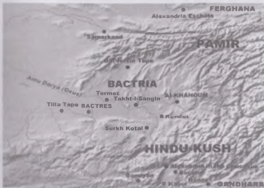
Baqtriya-yunon bosqinidan keyin

Mil.avv. 329-yilda Iskandar Amudaryoni kechib o'tdi va Bessni qo'lga olib, uni qatl ettirdi. Biroq, bu bilan Baqtriya hududida bosqinchilarga qarshi kurash to'xtab qolmadi. Amudaryoning o'ng sohilida va So'g'diyona (hozirgi O'zbekiston) hududida Iskandarga qarshi Spitamen boshchiligida keng ko'lamlil xalq qo'zg'oloni boshlandi. Iskandar ushbu qo'zg'olonni bostirish uchun uch yil vaqtini sarfladi. Shunda ham Spitamenni qo'lga ololmadi. Qo'zg'olonchilar bosqinchilarga qarshi pistirmalar qo'yish va yirik janglarga kirmaslik taktikasini qo'llab qaqshatqich zarba berdilar.