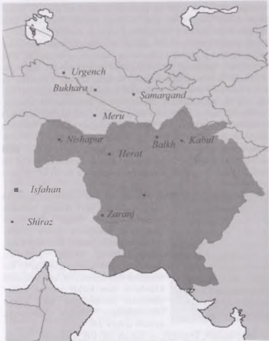
Durroniylar davlat hududi (1747–1862)

1729–1732-yillardagi harbiy harakatlari tufayli Nodirquli yetakchiligidagi qo‘shin Hirot shahrini egalladi. So‘ngra, Erondagi afg‘on qabilalari bilan bo‘lgan bir necha janglarda muvaffaqiyatga