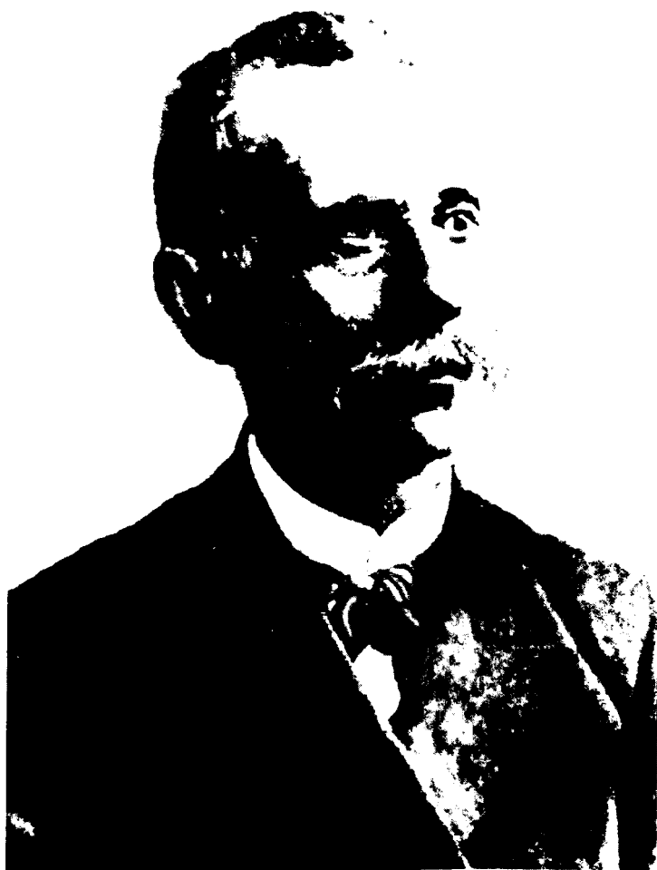
Исмоилбек Гаспринский (1851 – 1914)