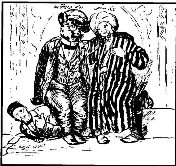
Карикатура, опубликованная в журнале «Молла Насреддин» (И. Гаспринский под сильным давлением русских чиновников и местных фанатиков)

Гаспринский, основав школы «усули джадид» в Крыму, принялся за внедрение этого проекта и на других заселенных мусульманами территориях. По его мнению, толчком к выводу мусульман из отсталости должно было стать обновление образования, метода обучения.