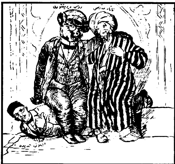
«Мулла Насриддин» журналида чоп этилган ўртоклик ҳазили. (И. Гаспринскийнинг маҳаллий дин пешволари ва рус амалдорлари томонидан қаттиқ эзилиши)

Рус миссионерларининг шу йўналишдаги хатти-ҳаракатларига биринчилардан бўлиб бош кўтариб чиққан ҳам И.Гаспринский бўлди. У мустамлакачилар томонидан олиб борилаётган сиёсатга бўлган муносабатини ўзининг машҳур «Русия мусулмонлиги» (1881) асарида изоҳлаб берди.