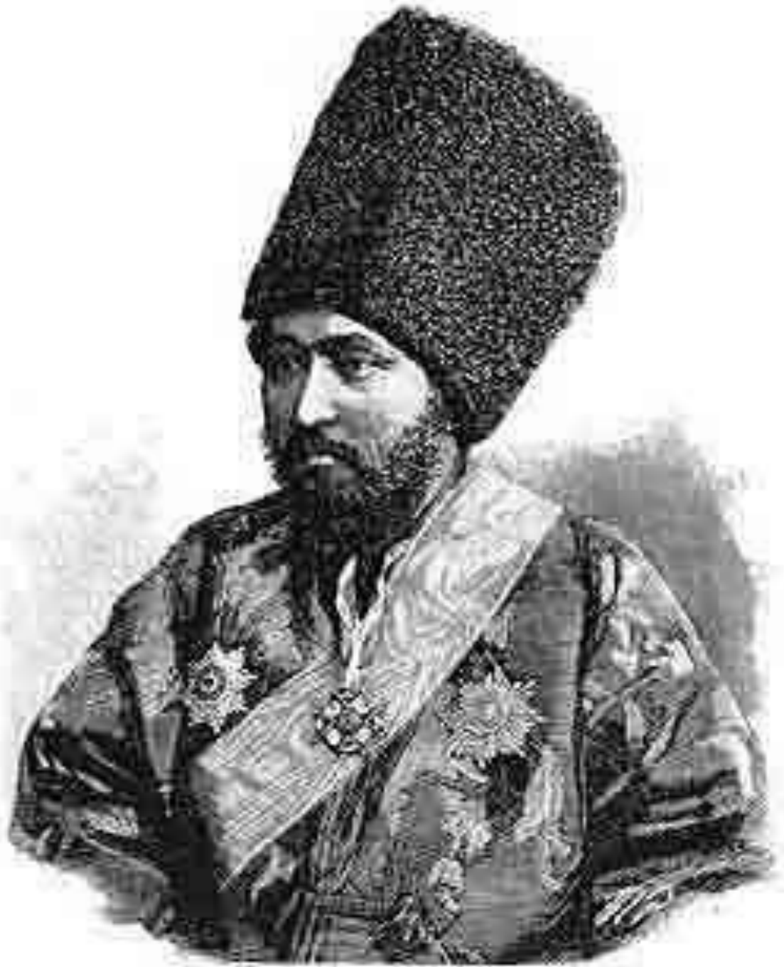
Наше гостя съ дально Востока. Хивинскій Ханъ Саядъ-Магомедъ. Изъ фототр. Троицкаго, графъ Д. Барятинскій.