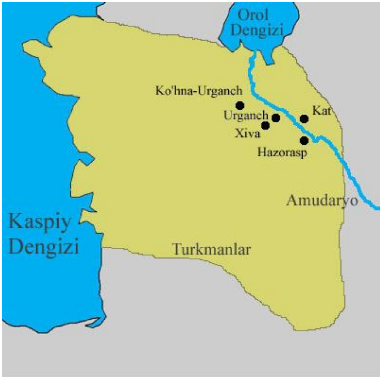
Xiva Xonligi (1511-1920)