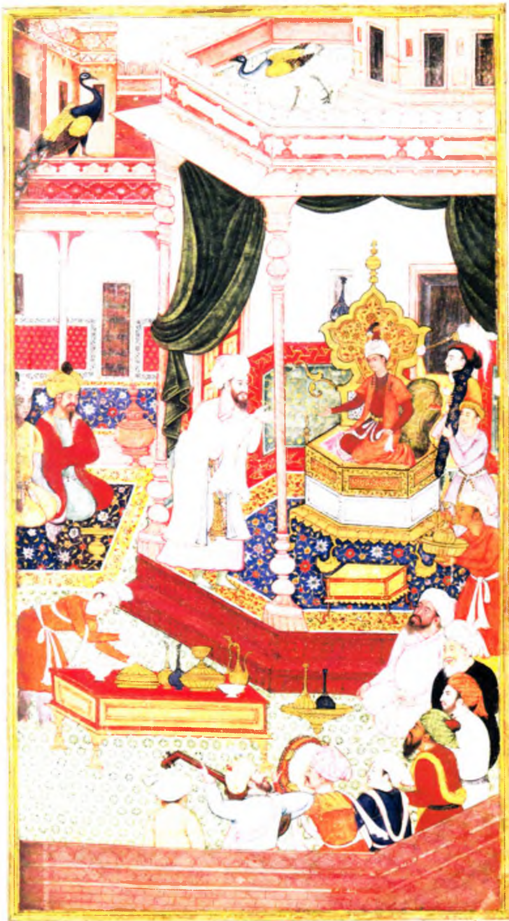
Бобурнинг тож кийиб Фарғона тахтига чиқиши (в. 2 б)