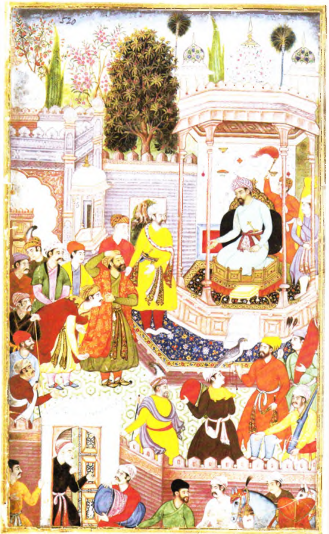
Бобур Бенгалия элчисини қабул қилмоқда (в. 357 а)