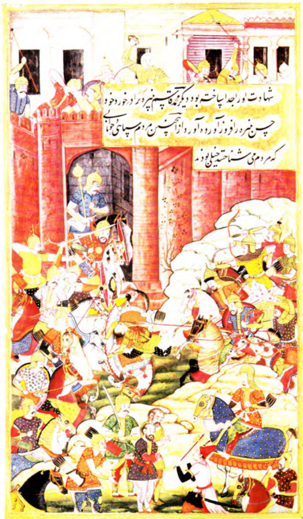
Бобурнинг Самарқандда кутиб олиниши (в. 44 б)