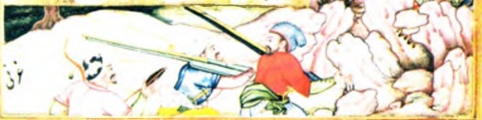
Бобур Лашт қишлоғини ишғал қилмоқда (в. 145 а)

از انجا براه سنگ مورخ برشته جهانگیر میرزا را رخصت