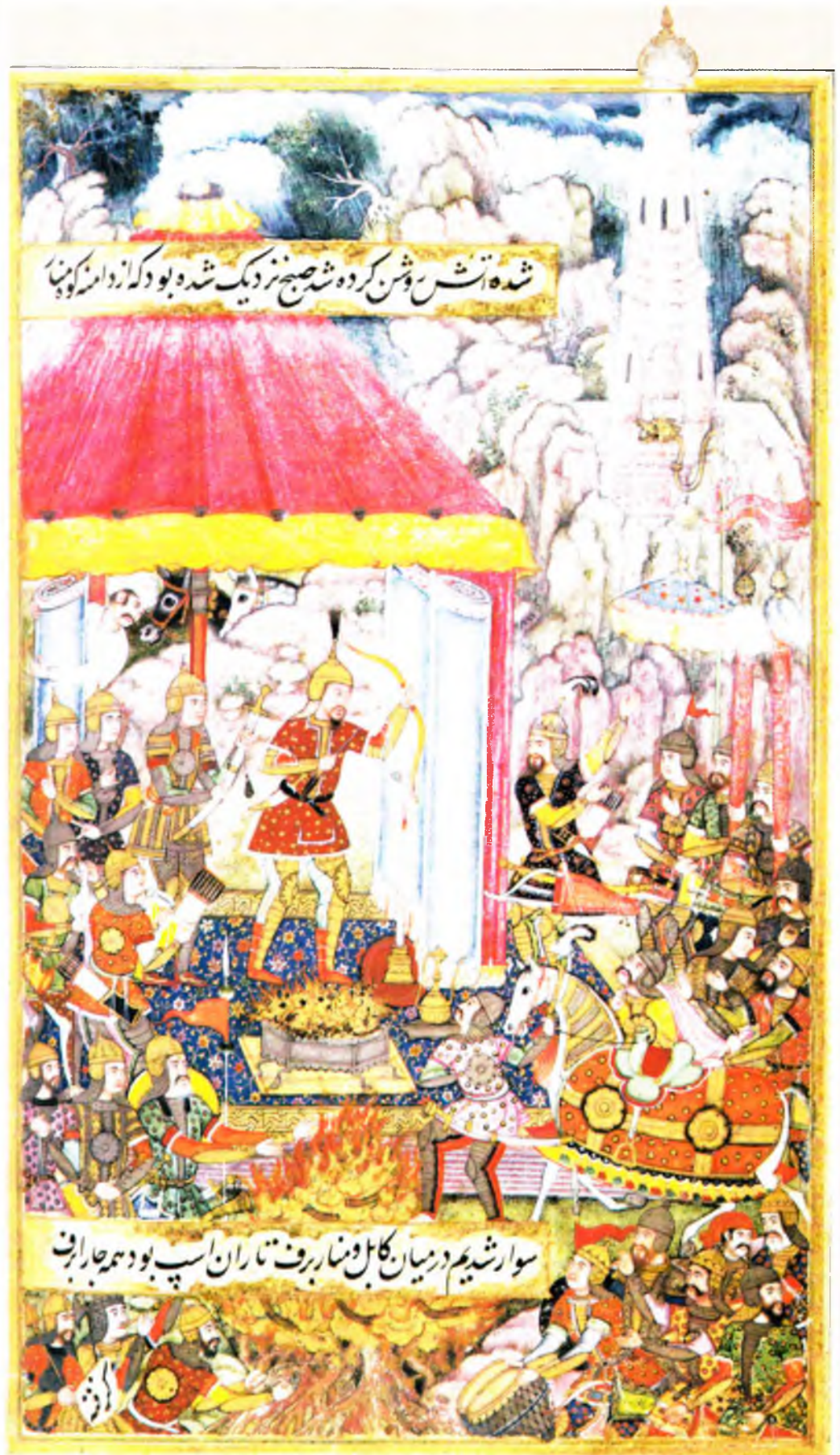
Бобур гулхан атрофида (в. 197 б)