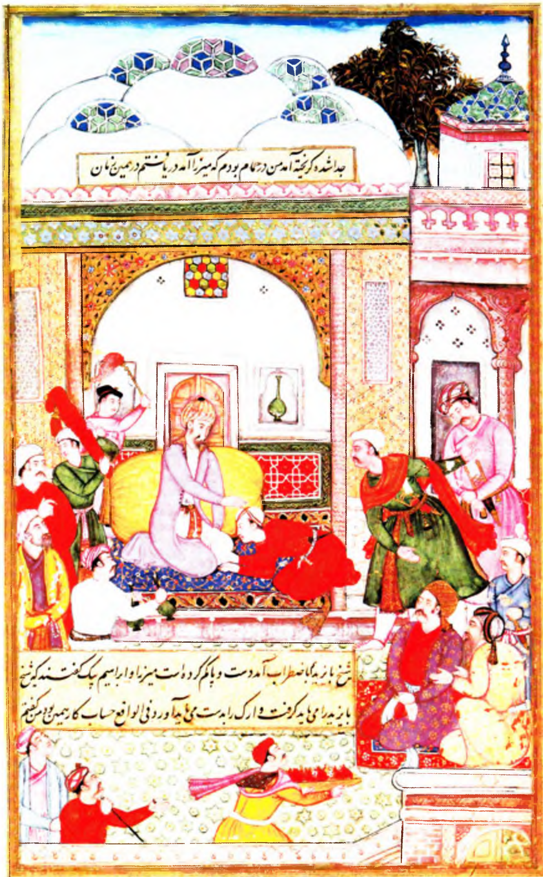
Жаҳонгир мирзо Бобур хузурида (в. 3 а)