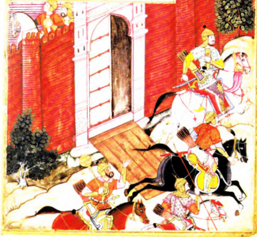
Бобурнинг аркка жунаши (в. 24 б)

چه آینه نمر پادشاه کند و احاطه این بن بقصوب بسیار امر او چو هم خوب نبود کفر مردم و تم قف شده بود و در خرابی قاسم یک توپین علی دوست طغایان و عینی از دو توانان کرمشالدگان این سپاهت یک جمع شده سخن را اینجا در چرخ برب را منقول نمود و شد از اسپکن پادشاه و دو بسیار زبان قدس این دولت یکم بود و باشد بسیار عاقده بر بود اثر کار مهم شورت در کار جمع دو و در قفسه سپکن فسطحه بود بر عیس جعفری سوزنده در کار جمع دو و در قفسه سپکن فسطحه بود بر عیس جعفری سوزنده