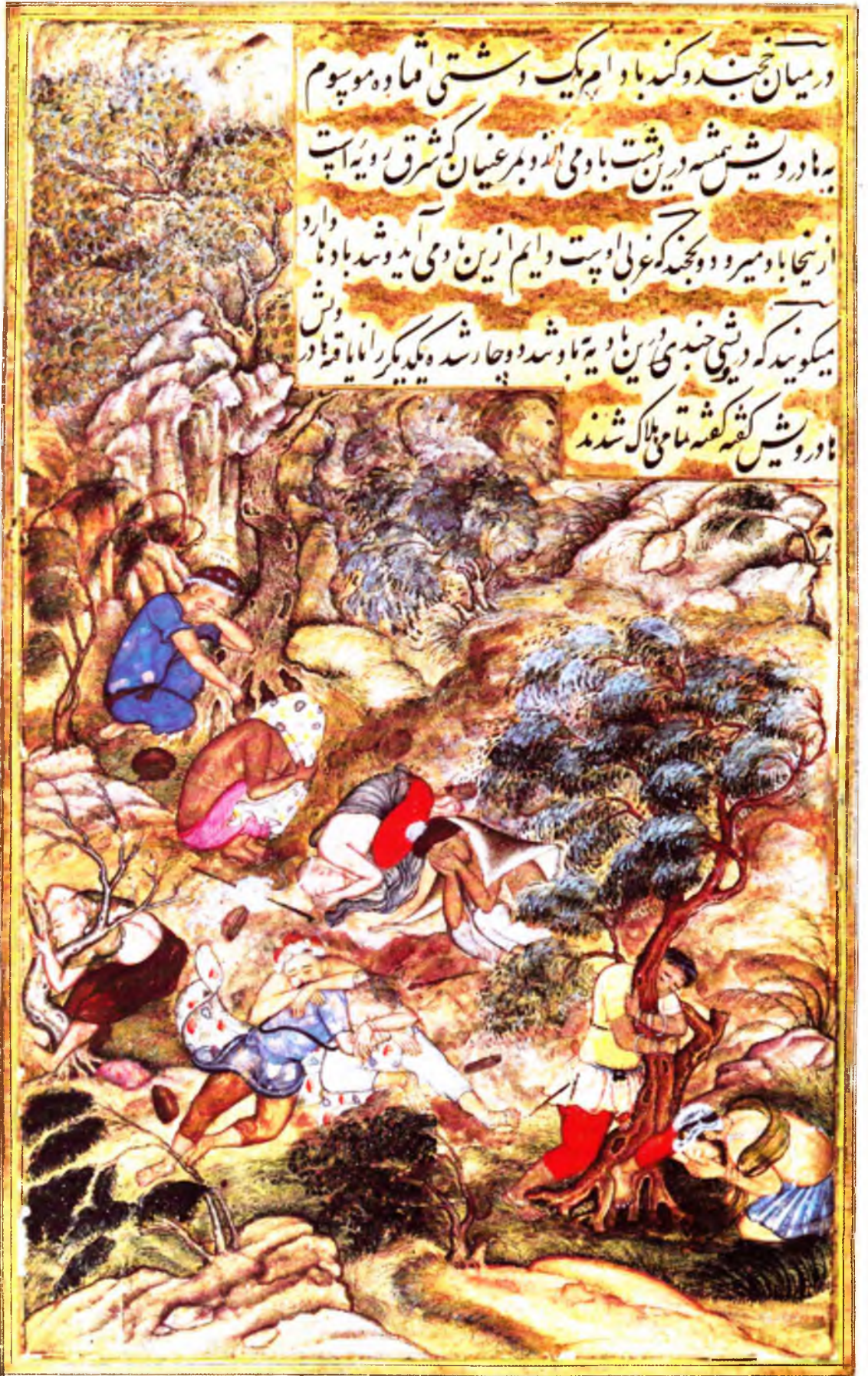
Ҳодарвеш даштидаги бӯрон (в. 46)

در میان خجند و کند باد امر یک دشتی اقاوه موپوم بباد و شمس در دشت باد می اندو بر عیان کن شرق رویه است از اینجا باد می رود و بچند که غری اوست و ایم ازین باد می آید و شد باد ناوارو میگویند که در شیبی خجند می آید و باد می شود و چار شد و یکدیگر را ناما یا قه در باد و شمس کشفه تا معنی هلاک شدند