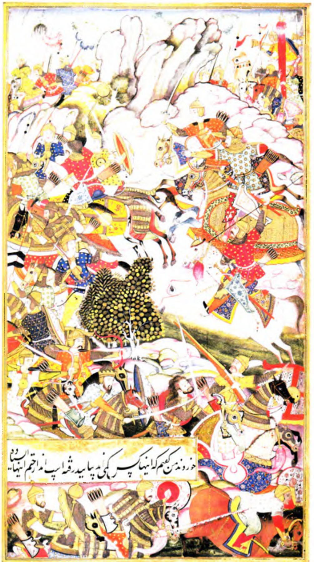
Чихдухтарон жанги (в. 105 а)