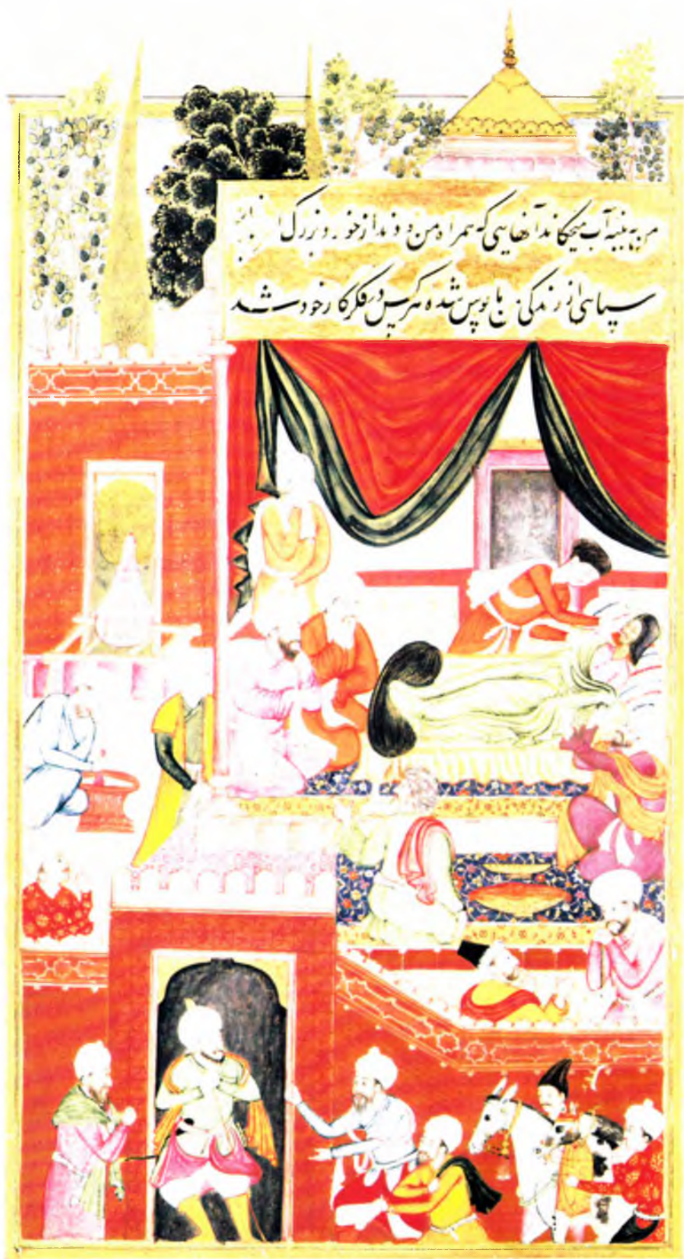
Бобур касал ҳафта (в. 53 а)

مریہ نیند آب میچکا ندا خانیسی کہ سمر اہمن و فدا از خور و بزرگ سپاسی از زندگی با بوس شدہ کسین در فکر کا ر خود شہ