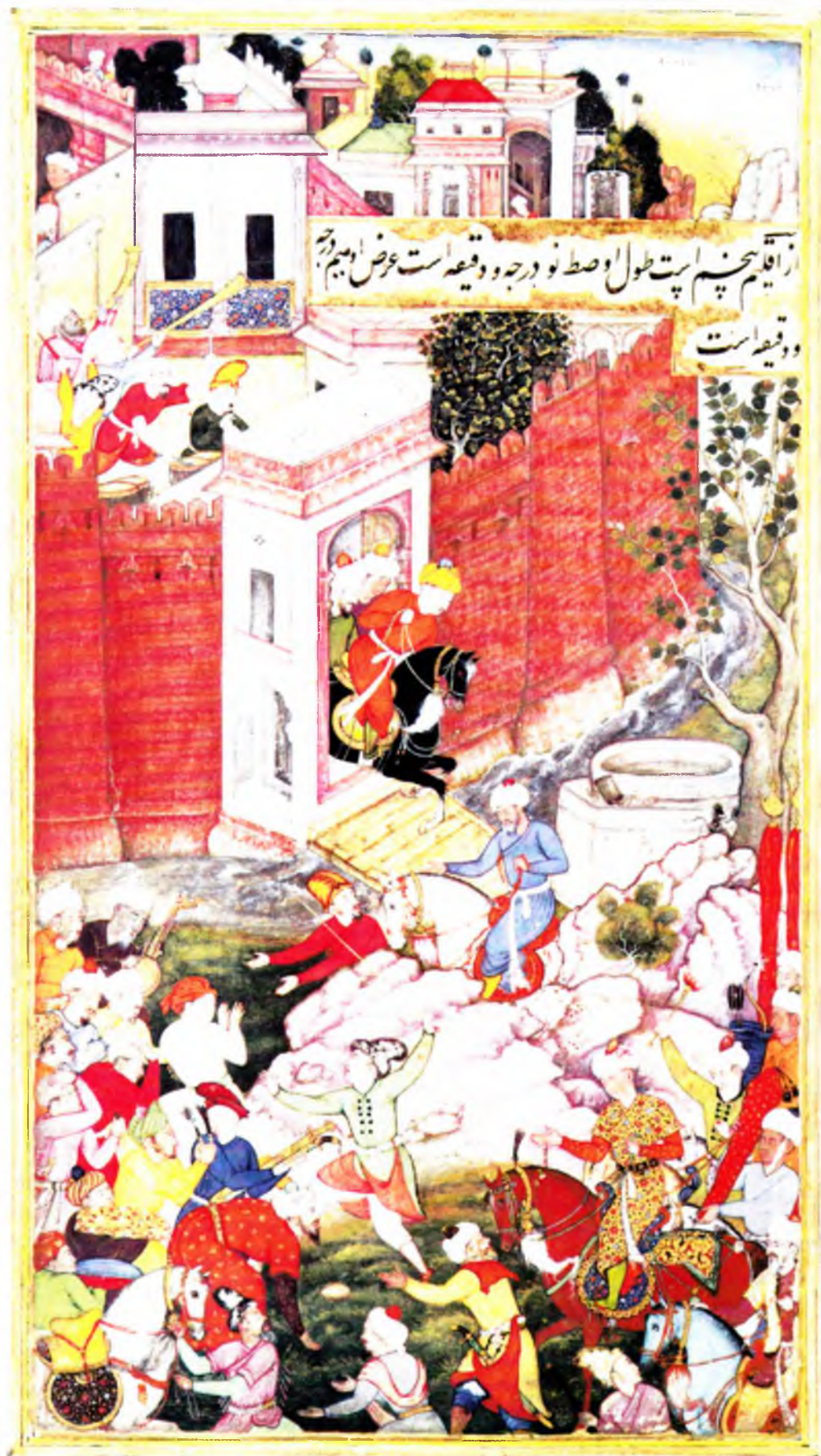
Бобурнинг Самарқандга кириши (в. 44 б)