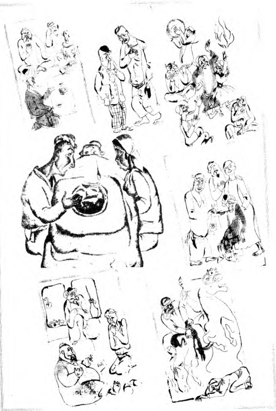
Тельман Мухаммад ўгли чизган суратлар