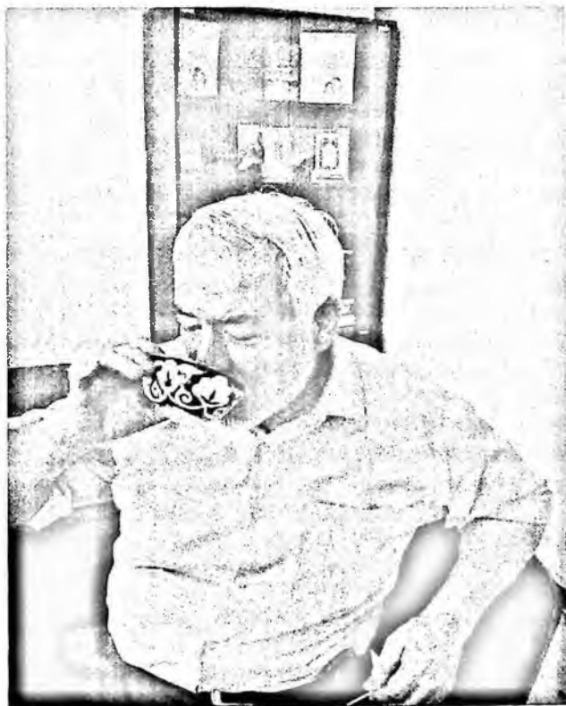
Академик Б.А.Назаров машаққатли меҳнатдан сўнг

Шу нарсани таъкидлаш лозимки, Бахтиёр Назаровнинг Ўзбекистонда адабий-танкидий тафаккур тараққиёти масалаларига бағишланган тадқиқотлари босилиб чиққандан кейин республикамизнинг 17 дан ортиқ олий ўқув юртлари ва малака ошириш институтларида адабий танкид бўйича махсус курслар ташкил этилди. Филология факултетларида адабий танкиднинг махсус фан сифатида ўқитилишида, алоҳида курслар очилишида, шубҳасиз, Бахтиёр Назаров тадқиқотларининг ўрни ва аҳамияти катта. Олимнинг ижодий фаолиятини ўрганиш асносида бу фикрларга тўла ишонч ҳосил қилиш мумкин.