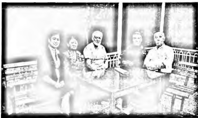
Академик Б.А.Назаров ҳамкасблари ва шоғирдлари даврасида. (Чапдан ўнга: З.Мирзаева, Ш.Аҳмедова, Б.Назаров, Т.Қахҳор, О.Каримов)

Ўзбек адабиётида замонавий танкидчиликнинг пайдо бўлиши XX аср бошларига тўғри келади. Чўлпоннинг “Адабиёт надур?” (“Садои Туркистон”, 1914) ва “Мухтарам ёзувчиларимизга” (“Садои Туркистон”, 1915), Маҳмудхўжа Бехбудийнинг “Театр надур?” (“Ойна”, 1914) сингари мақолалари эълон қилиниши билан ўзбек адабий танкидчилигининг том маънодаги тарихи бошланди. Ёзувчи ва танкидчилар шу даврда чоп этилган адабий-танкидий мақолаларида бадиий адабиётнинг янги тарихий-маданий даврдаги мақсади, вазифаси ва йўналишини белгилаб беришга ҳаракат қилдилар.