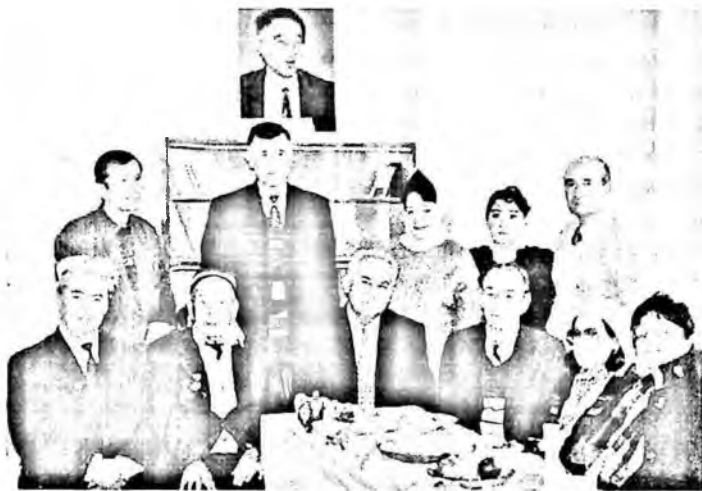
Академик Бахтиёр Назаров ҳамкасблари даврасида.