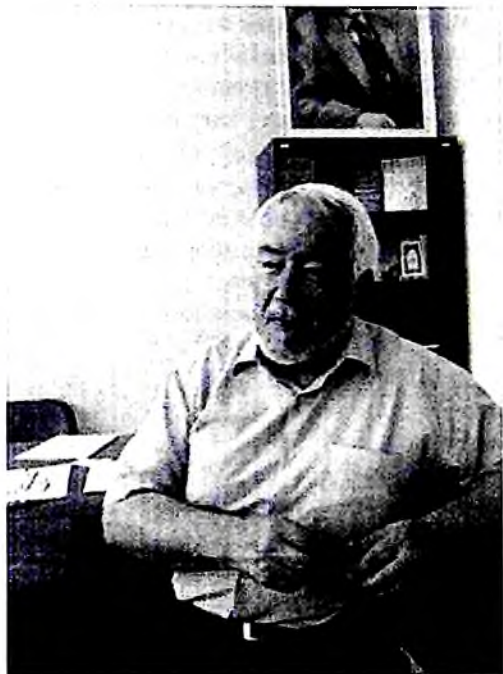
Академик Б.А.Назаров ижод оғушида.

инсоний кифаси хакида муайян тасаввурлар туғдириш учун етарли асос вазифасини ўташга қодирдир.