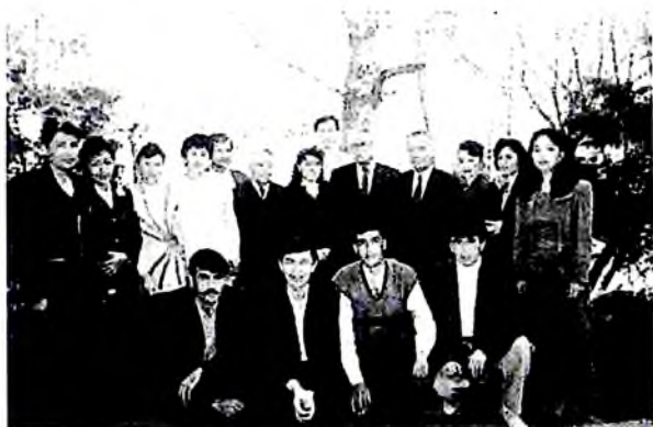
Академик Бахтиёр Назаров ҳамкасблари профессорлар Ғ.Мўминов, Т.Мирзаев ва бир гуруҳ шогирдлари даврасида.

Бугун “Болалар адабиётимиз истиқлол даврида нималарга эришди?” деган саволга жавоб излар эканмиз, аввало, ўтган йиллар давомида болалар адабиёти ўз табиий ўзанларига қайта бошлаганини қониқиш билан эътироф этиш жоиз. Биргина мисол: мустақилликнинг илк йилларидаёқ мактабларимизнинг янги дастурларига “Одобнома” фани киритилди. Янги дарслик ва ўқув қўлланмаларимиздан Кайковуснинг “Қобуснома”, Шайх Саъдийнинг “Гулистон” ва “Бўстон”, Алишер Навоийнинг “Ҳайрат-ул аброр”, Абдулла Авлонийнинг “Туркий Гулистон ёхуд ахлоқ” асарларидан олинган парчалар мустаҳкам ўрин эгаллади. Болалар адабиёти ўзининг маърифий-тарбиявий вазифасини бажаришга киришди. Буларнинг барчаси ёш авлоднинг маънавий комил инсонлар сифатида шаклланиши, ўз киндик қони тўқилган тупроғи, она Ватани, ўз халқи, ўз миллатининг содиқ фарзанди бўлиб етишишларида улкан маърифий аҳамият касб этиши шубҳасиз эди. Шуни ҳам алоҳида қайд этиш керакки, истиқлол даври янги ўзбек адабиётининг майдонга келишига 80-йилларнинг иккинчи ярмидаги адабиёт ҳам катта таъсир кўрсатди. Зеро, айти шу даврда болалар адабиёти том маънода ҳақиқатга тик боқадиган адабиётга айланди. Ёш авлодни эркесварлик туйғулари руҳида тарбиялашда илк қадамларни қўйди. Ана шу нуқтаи назардан, истиқлол даври болалар адабиёти ўсишда, улғайишда, ўзлигини