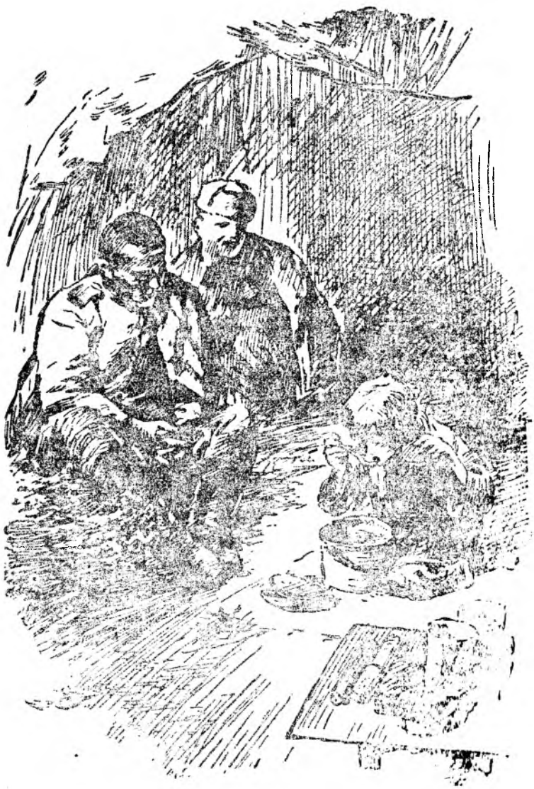
— Чунон бола, зарари йуқ, тортишма. Бемақол сипер.