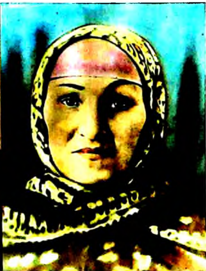
Тожи Қораевнинг падари бузруквори ва волидаи муҳтарамалари