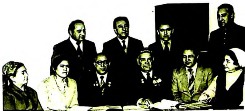
Устоз ва ҳамкасблар даврасида