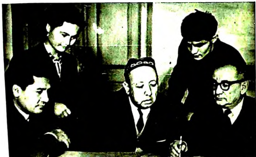
Машхур тилшунослар даврасида