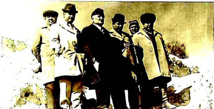
Академик Воҳид Абдуллаев шогирдлари билан Варахшада