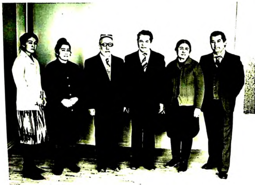
Ўзбек адабиёти кафедраси жамоаси