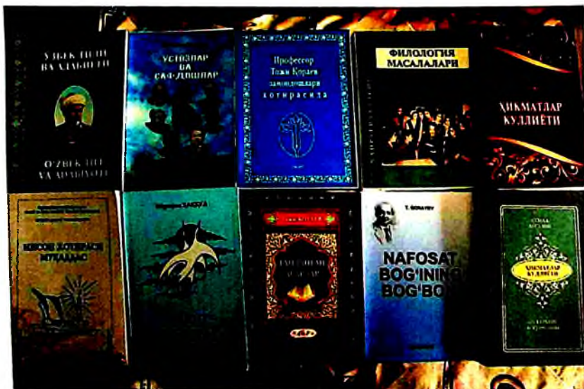
Олимнинг илмий ва ижодий асарлари