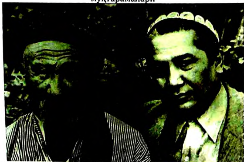
Ота ва ўғил