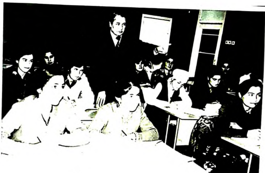
Замонавий ўзбек адабиёти фанидан машғулот