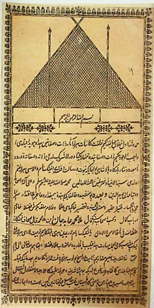
Муҳлис девонининг дебочаси