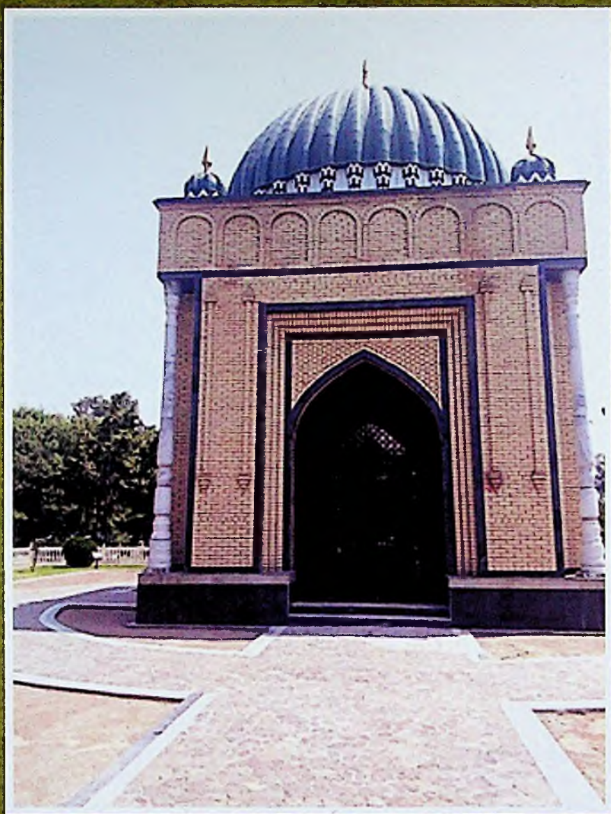
Нодим Намангоний макбараси