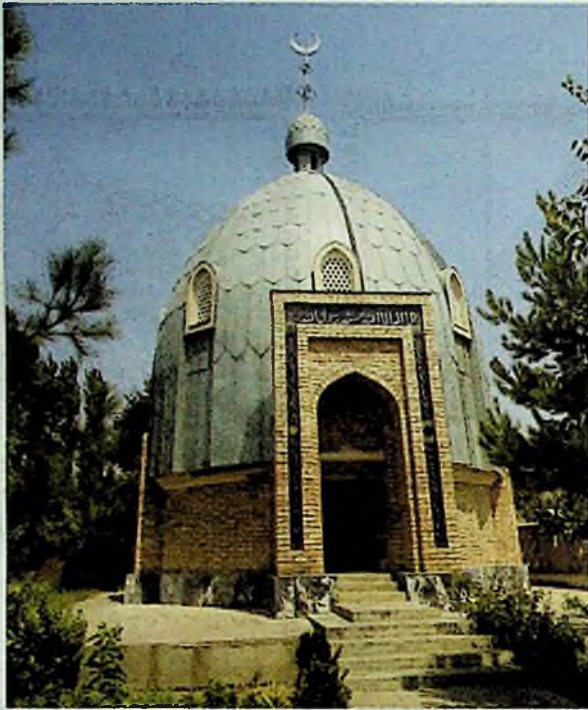
Мажзуб Намангоний мақбараси