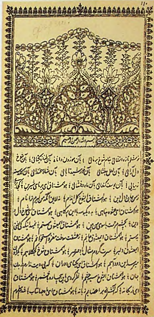
Баёзнинг форсий-туркий дебочаси