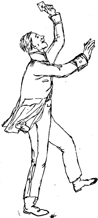
Почта мудир и.

Почта мудир и. Ҳеч боло эмас. Нотайин бир маҳлуқ!