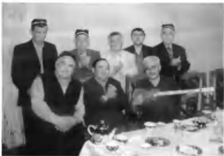
Сўз ва саз бирлашганда.