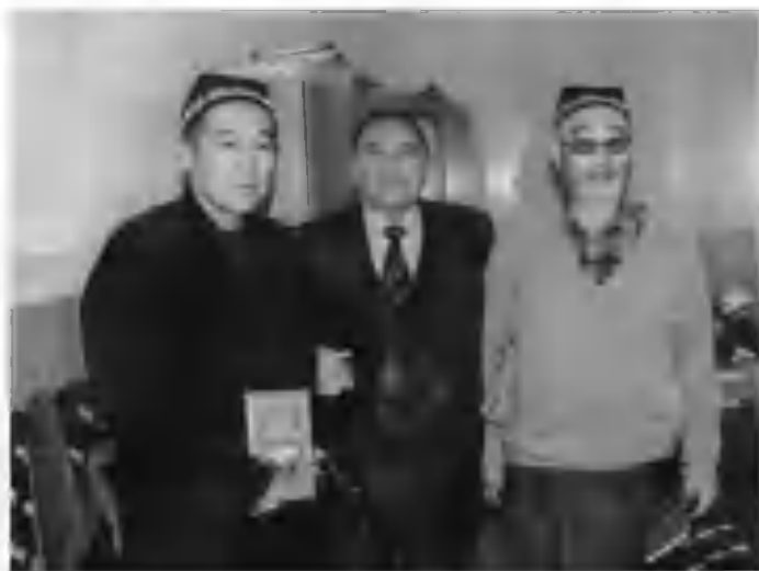
Япониялик меҳмонлар билан.