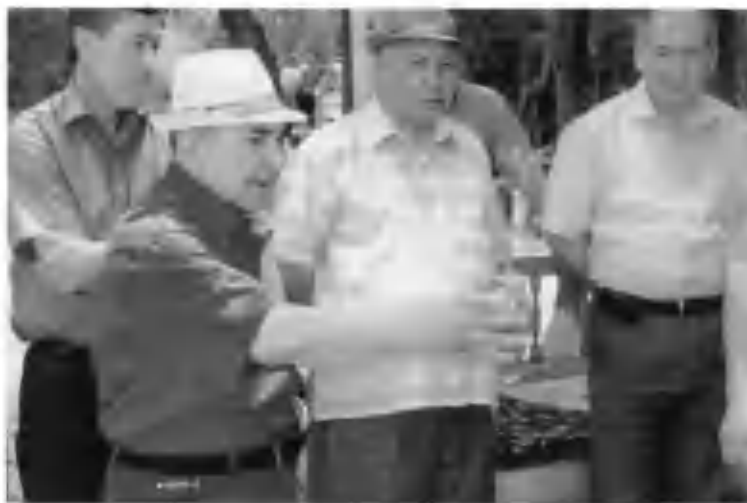
Табиатнинг қудратини қаранг: бугунги ниҳол — эртага азим дарахт!