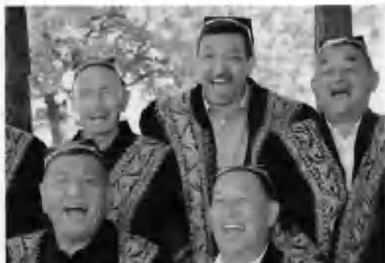
Кўқонлик машҳур кулги усталари давраси.