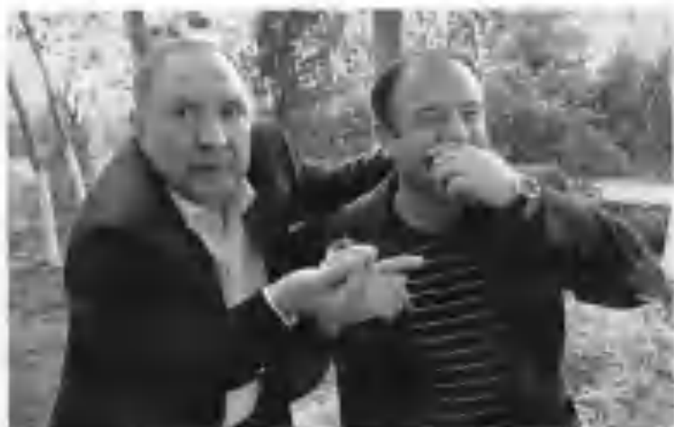
Кўқонча манзират: “— Емай кўрингчи, ошатамиз!...”