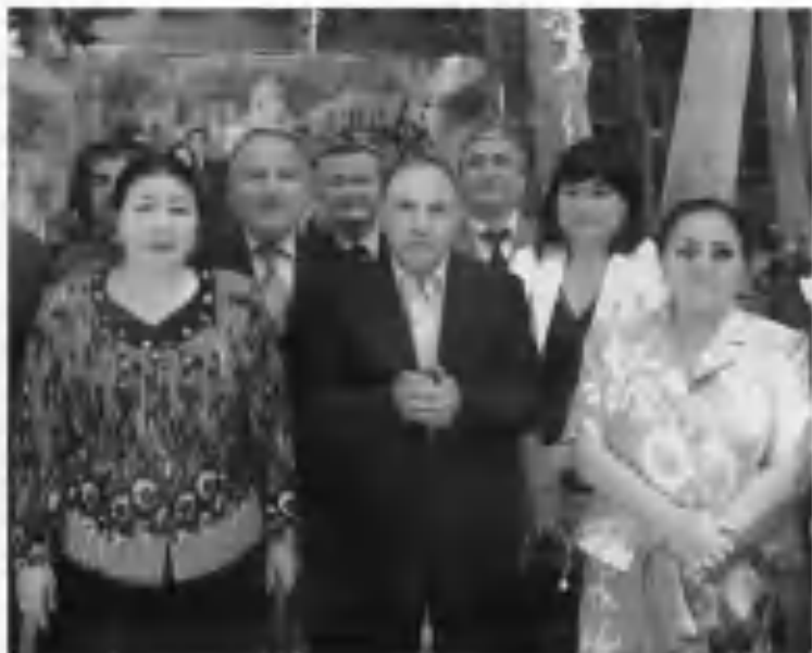
Хўқанди латифга меҳмонлар келди...