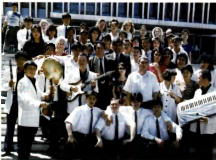
Талабалар билан учрашув. Андижон Давлат чет тиллар олийгоҳи.