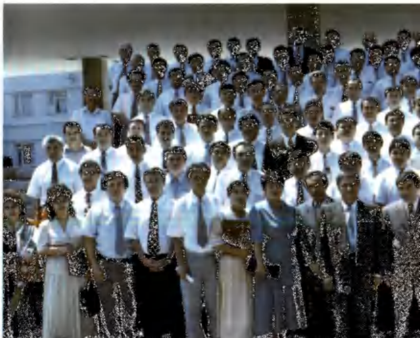
“Алишернинг авлодлари, илм истанг!” Академия мадҳияси б