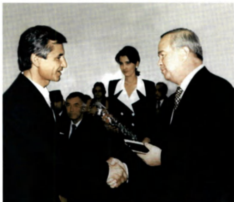
Ўзбекистон Президенти Ислам Каримов Муҳаммад Юсуфга “Халқ шоири” унвонини топширмақда. 1998 йил.

Сен шоҳлари осмонларга Мешиб турган гинорим. Ота десам, Ўғлим деб, Бош эшиб турган гинорим. Қўнминдаги ифтихорим, Қўйниндаги тўнорим. Ўзинг менинг уллардан Улуғимсан. Ватаним!