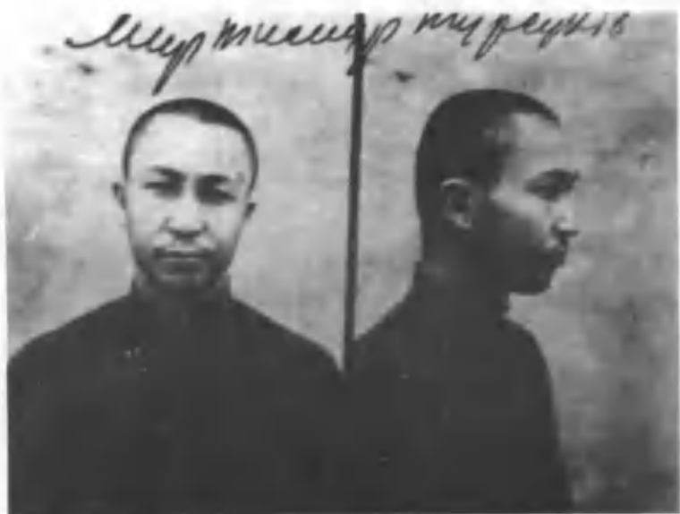
Миртемирнинг қамоқхонада олинган сурати. 1932 йил.