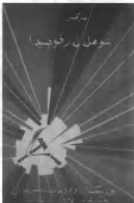
Миртемирнинг “Шуълалар кўйнида” илк шеърлари тўплами, 1926 йил.