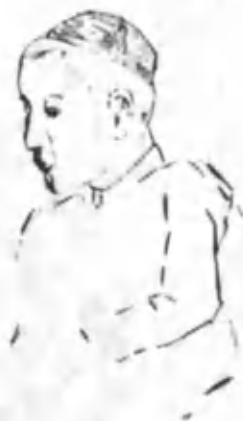
Шоирнинг болалиги Номаълум рассом чизган