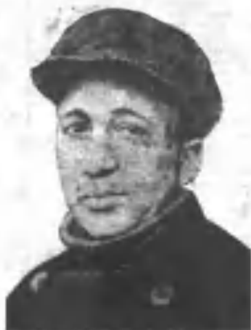
Миртемир Москва-Волга канали қурилишида. 1932-1934 йиллар.