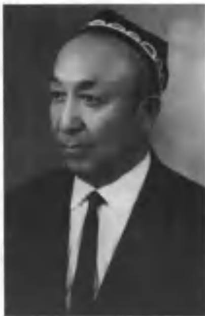
Миртемир. 1971 йил.