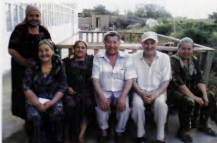
Падари бузруквор хонадонида (2006 й).