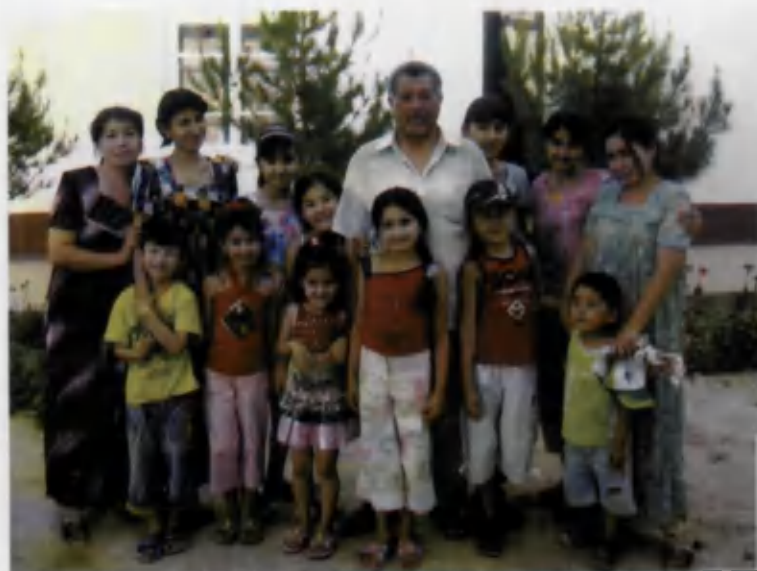
2006 йил 30 ноябрь. Уй олдида, эсдалик учун.