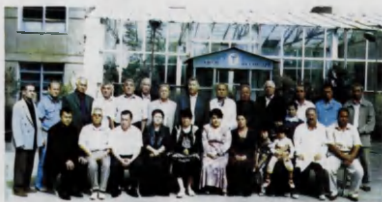
2008 йил, сентябрь. Китоб тумани. Паландара санаториясида тиббиёт ходимлари анжуманида.