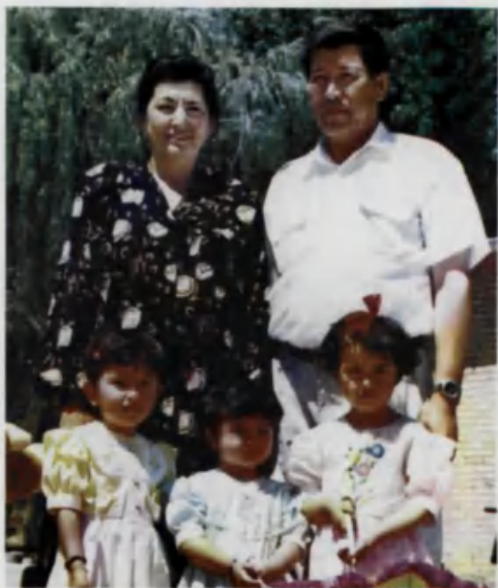
1997 йил 1-сентябрь – Мустақиллик байрамида.