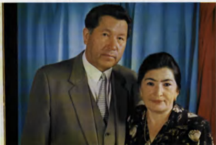
1998 йил, май – 30 йиллик тотув ҳаёт ифодаси.