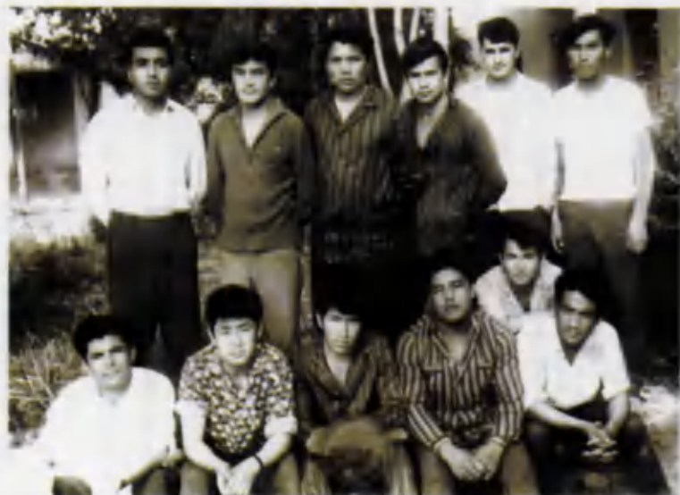
Самарқанд тиббиёт олийгоҳи талабалари – гуруҳдош дўстлар.