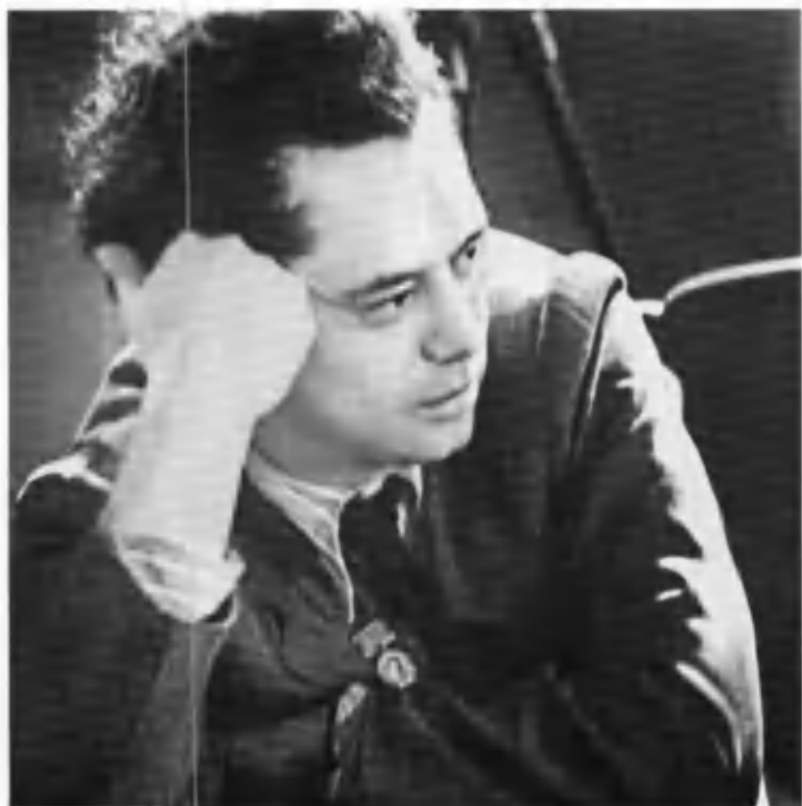
Ойбек. 1948 йил