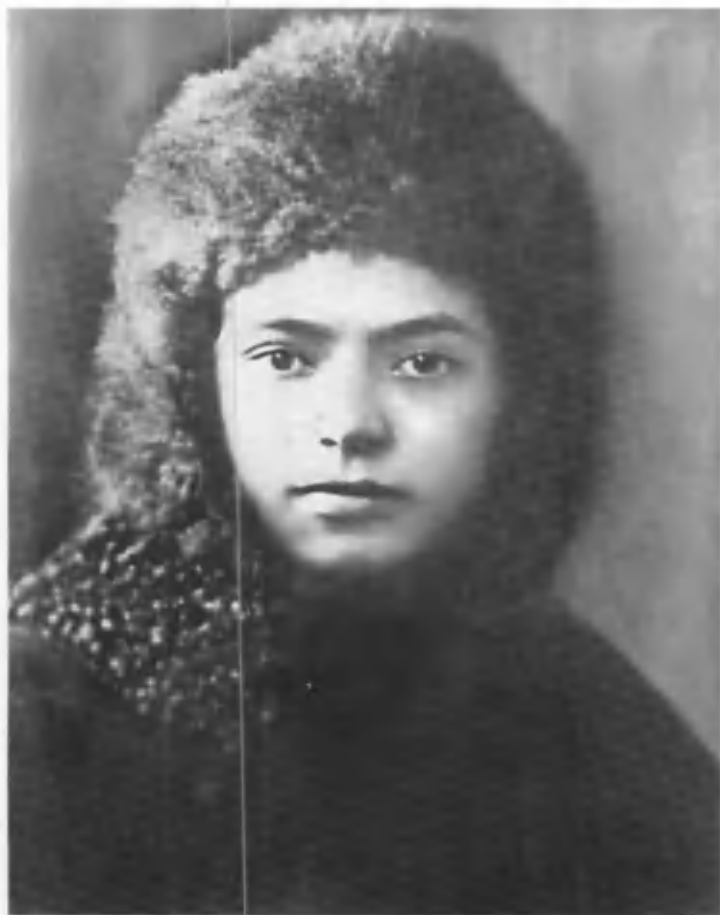
Ойбек. Ленинград, 1929 йил