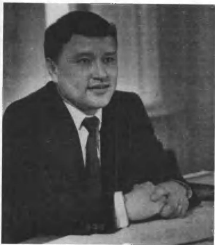
F. J. [Name] [Title] [Address] [City, State, Zip]