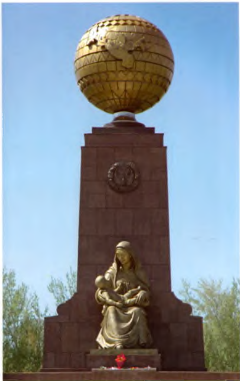
Тошкент. Мустақиллик ва эзгулик монументи