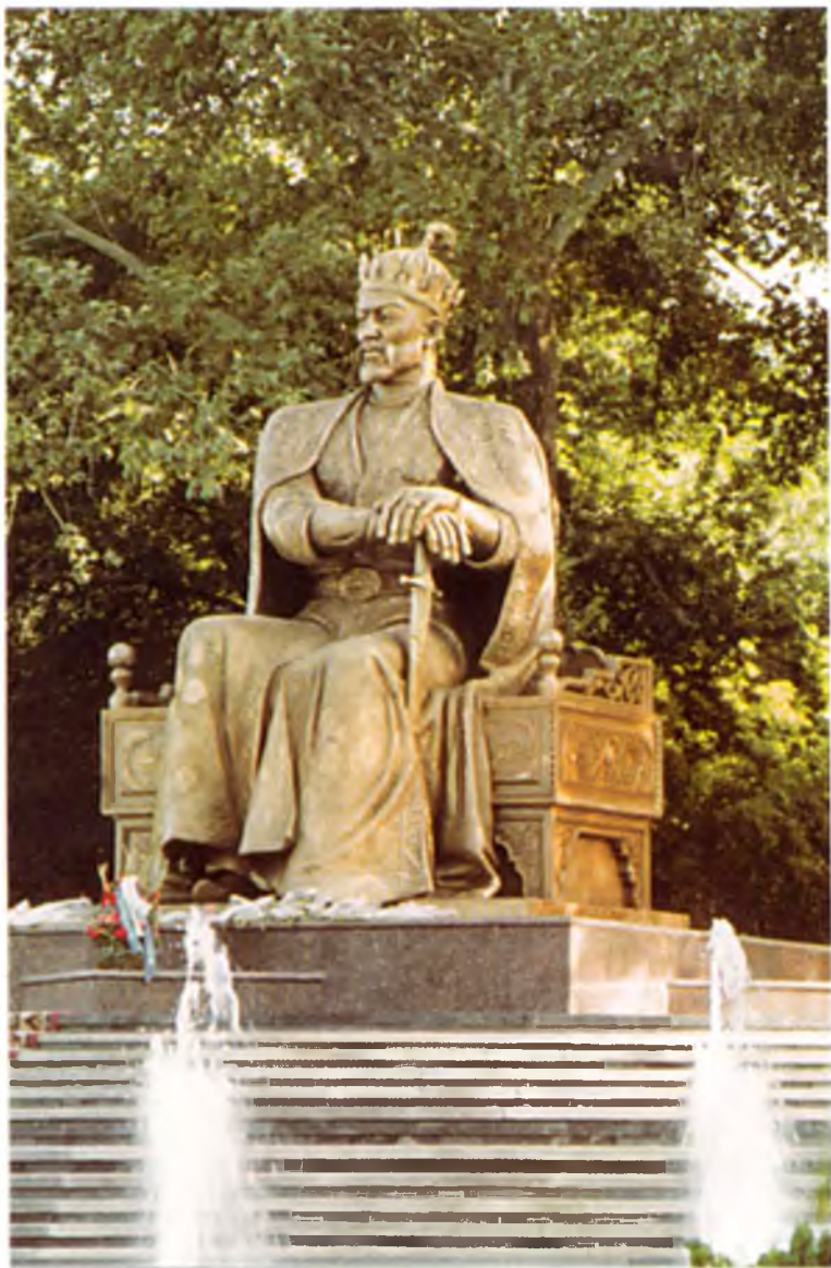
Самарқанд. Амир Темур хайкали