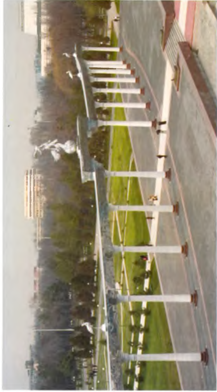
Тошкент. Эзгулик аркаси