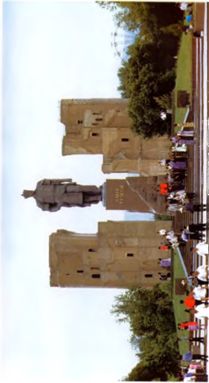
Шахрисабз. Амир Темур хайкали