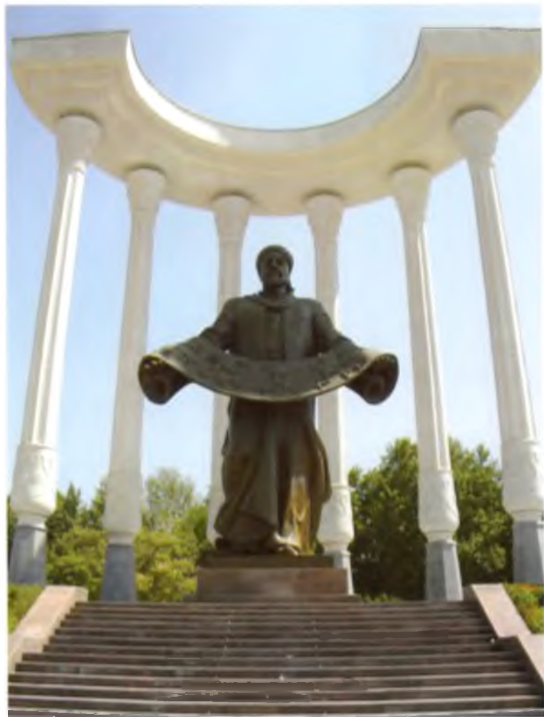
Фарғона. Аҳмад Фарғоний хайкали