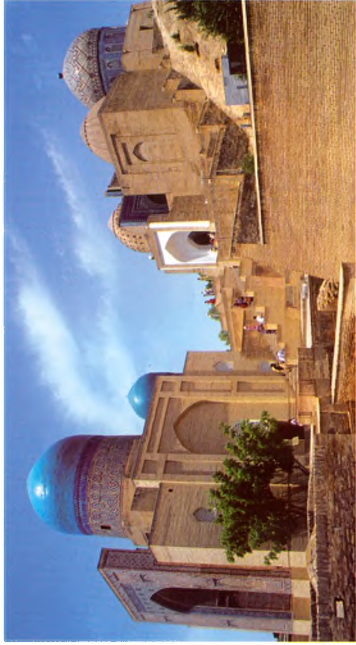
Самарқанд. Шоҳи Зинда