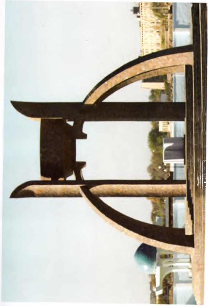
Урганч. «Авесто» ёдгорлиги