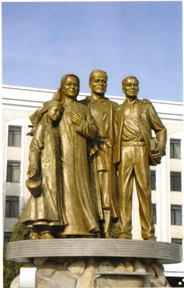
Қарши. «Эл-юрт таянчи» монументи