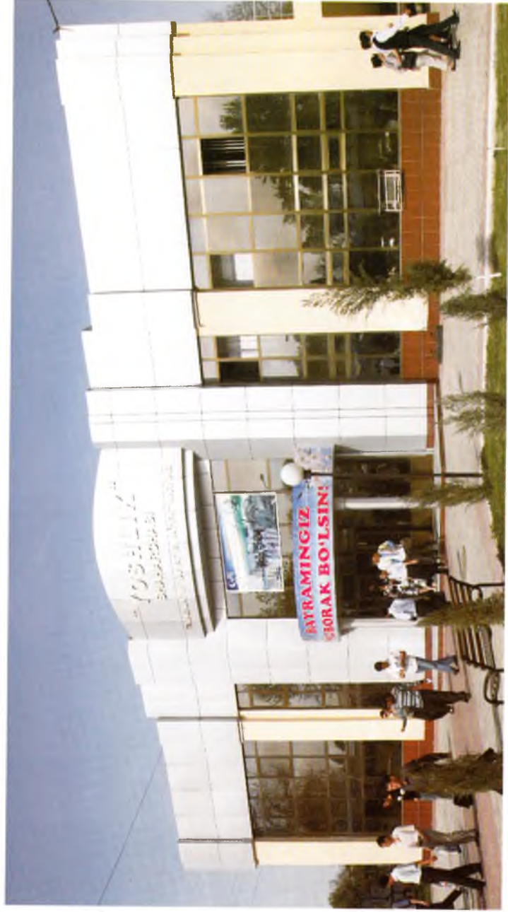
Тошкент. «Ёшлик» талабалар шаҳарчаси. Маънавият ва маърифат маркази