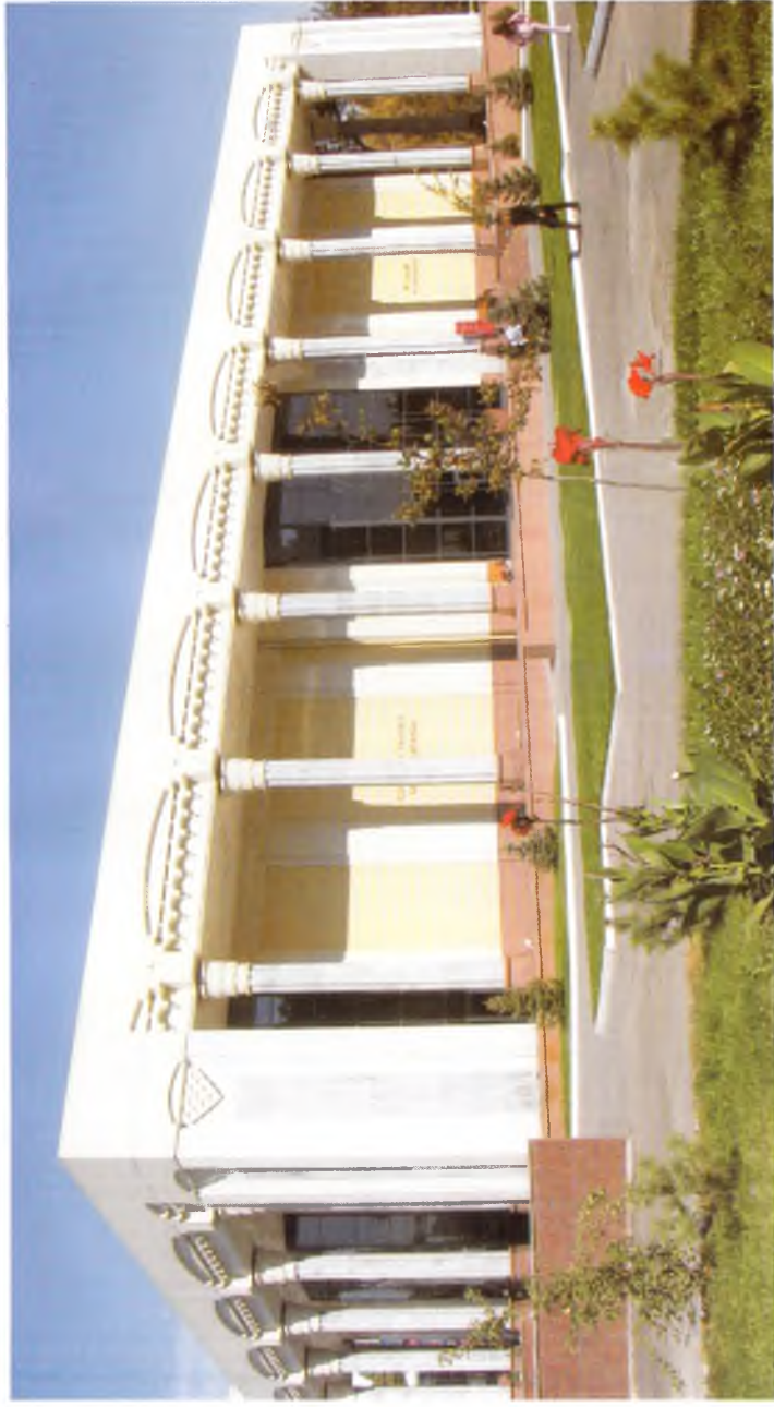
Тошкент. Тасвирiy санъат галереяси