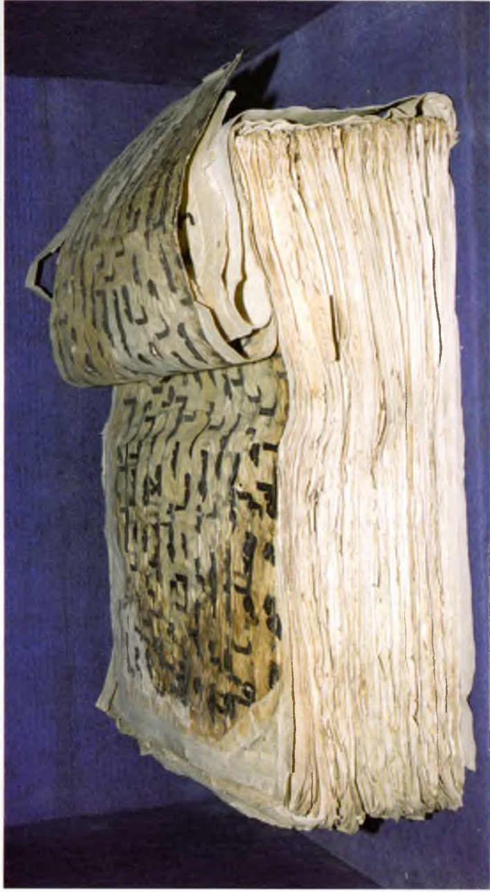
Тошкент. Ҳазрати Имом мажмуаси. Мукаддас Усмон Куръони