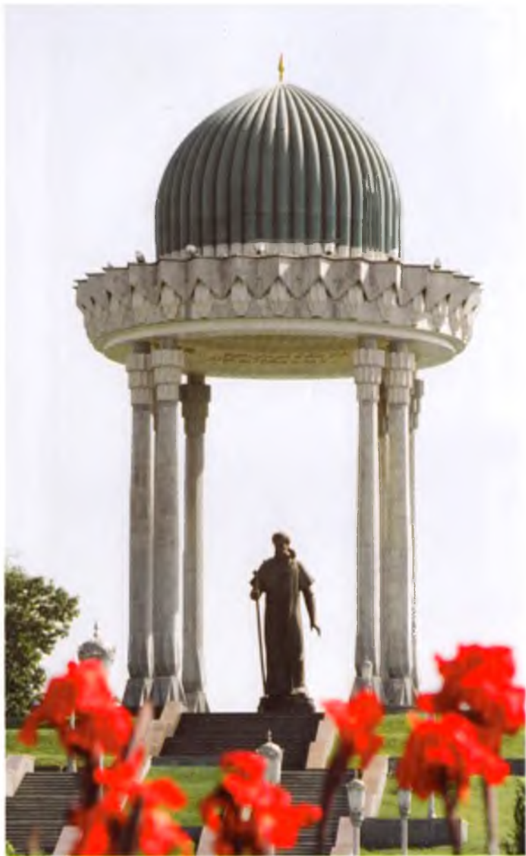
Тошкент. Алишер Навоий ҳайкали