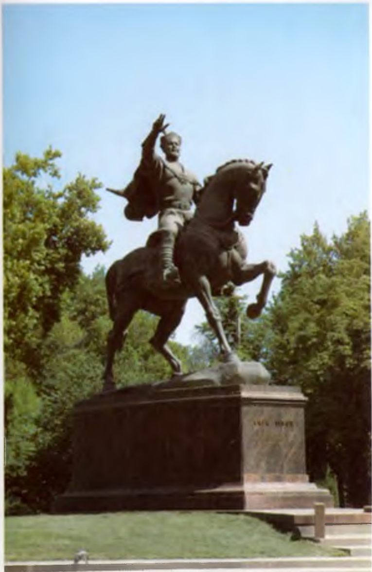
Тошкент. Амир Темур хайкали