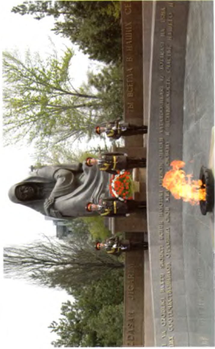
Тошкент. Мотамсаро она монументи