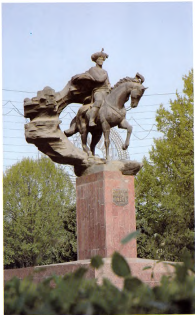
Андижон. Бобур ҳайкали