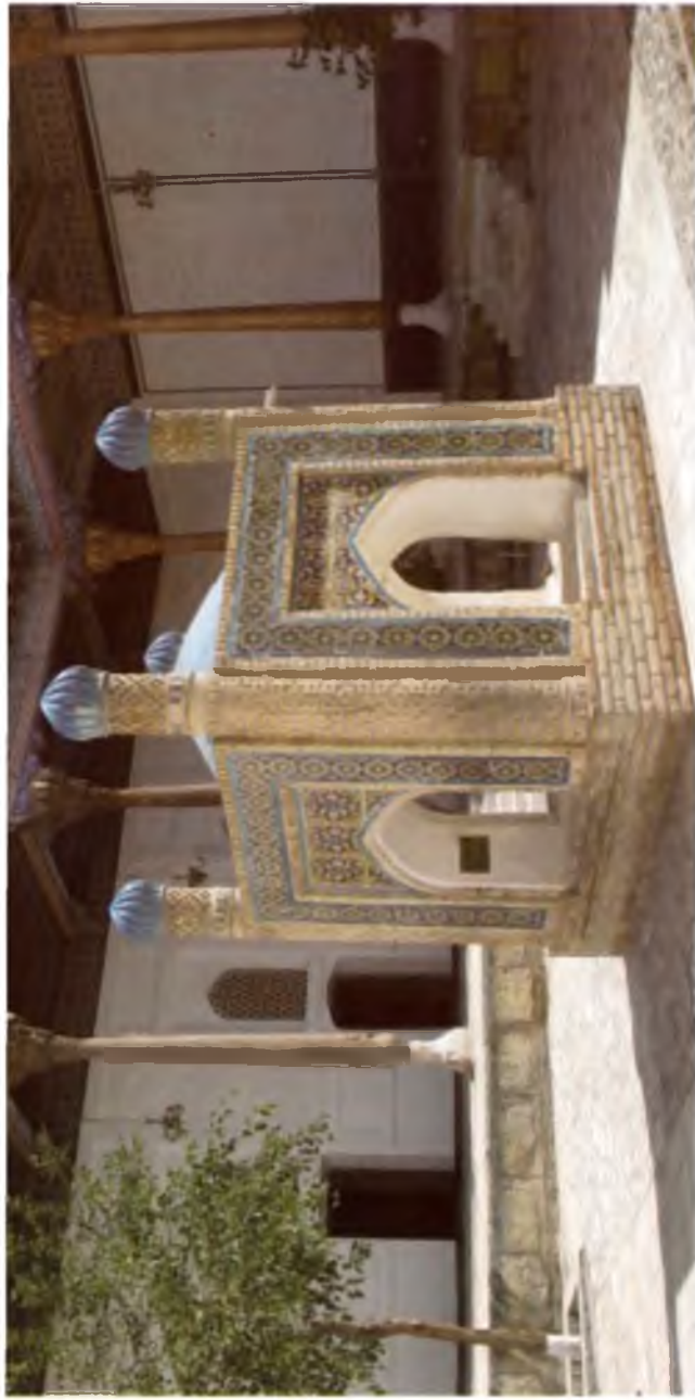
Бухоро. Баҳоуддин Нақшбанд зiyorатгоҳи