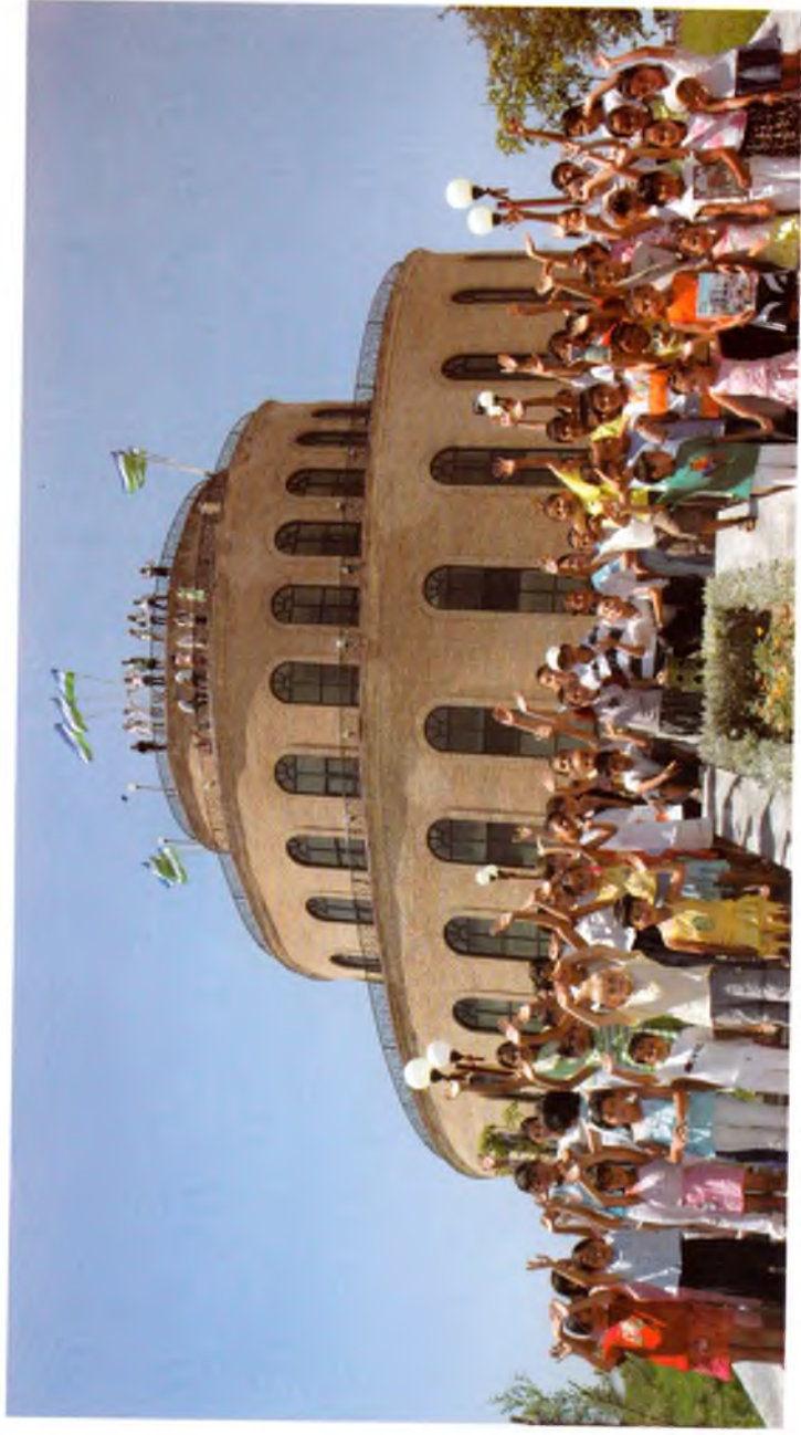
Тошкент. Болалар ижодиёти маркази