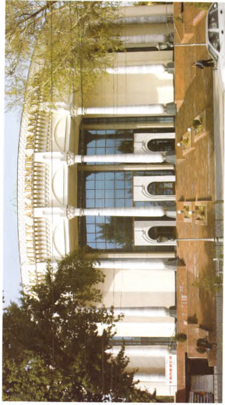
Тошкент. Ўзбек миллий академик драма театри