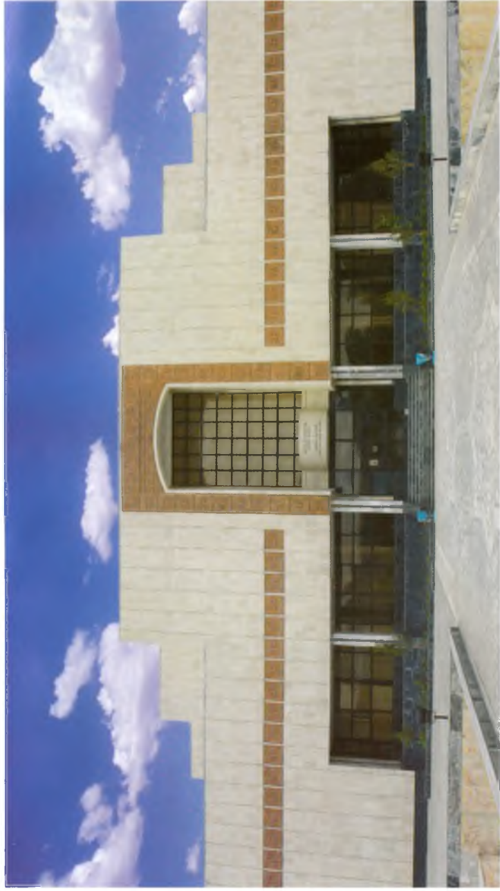
Нукус. Қорақалпоғистон санъат музейи