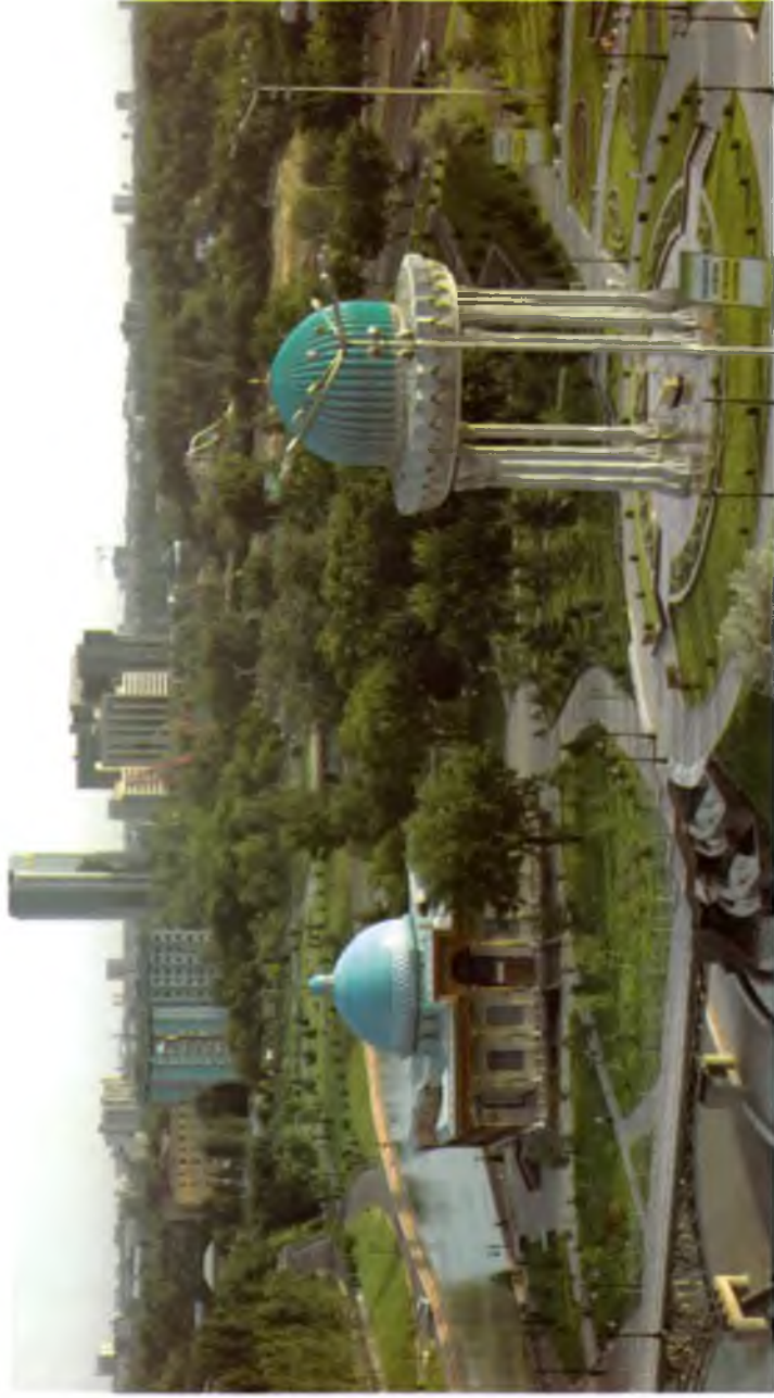
Тошкент. «Шахидлар хогираси» ёдгорлик мажмуаси