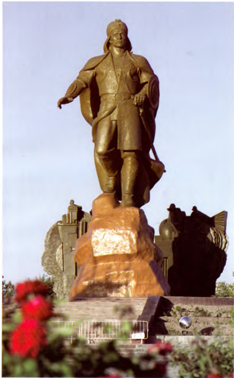
Урганч. Жалолиддин Мангуберди хайкали