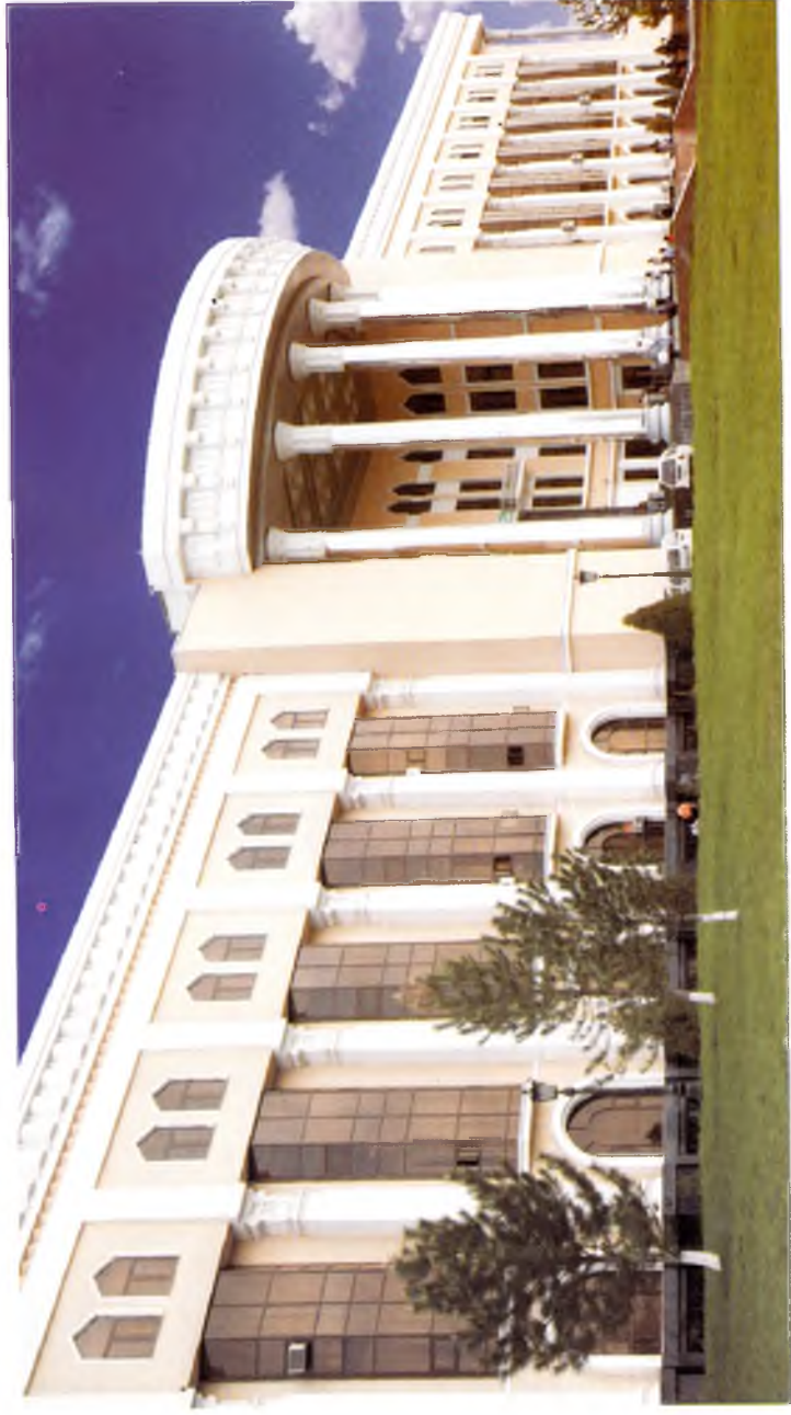
Тошкент. Ўзбекистон давлат консерваторияси