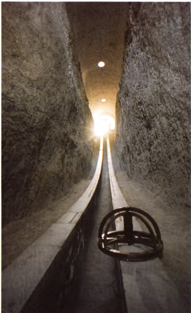
Самарқанд. Улуғбек расадхонаси