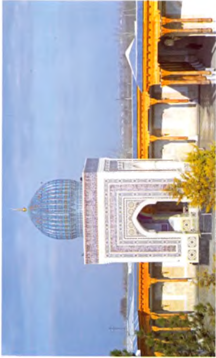
Самарқанд. Имом Бухорий ёдгорлик мажмуаси