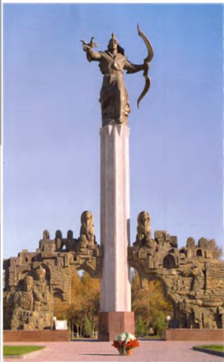
Термиз. Алпомиш ёдгорлиги