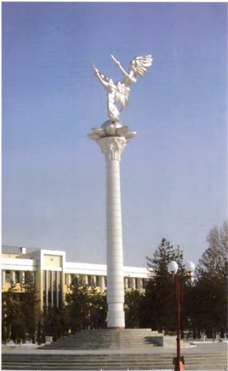
Наманган. Тинчлик стелласи