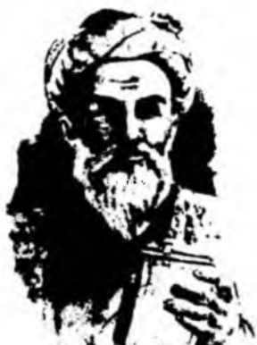
Abu Ali ibn Sino (980—1037).

bo'lgan Buxoroga ko'chirib olib kelgan. Buxoroda Abdulloh Husaynni dastlab, odatdagidek, shahardagi yaxshiroq hisoblangan musulmoncha diniy maktablardan biriga o'qishga bergan. Bu yerda Husayn arab alifbosidan savod chiqarganidan so'ng u Qur'on va adab ilmini o'rganishga kirishgan.