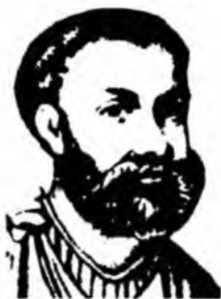
Klavdiy Galen (131—201).

Galen har xil kasalliklarning kelib chiqishi masalasida o'sha vaqtda keng tarqalgan gumoral (rutubatlar) nazariyasiga asoslanardi. Kasalliklarni davolashda Galen bir qancha yangi muolaja usullarini ishlab chiqdi. Xususan, u doridarmonlardan foydalanishning yangi usullarini qo'lladi. Dori tayyorlashda ularning shifobaxsh qismini ajratib olib ishlatishni joriy qildi. Bunday dorilar "Galen preparatlari", deb ataladi. Galen har qanday dorivor o'simlikda, dorilik moddadan tashqari keraksiz, ba'zan esa zararli moddalar ham bo'lishi mumkin, biz dorilik moddasini undan ajratib olishimiz kerak, deb to'g'ri fikr yuritgan.