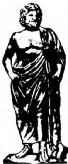
Asklepiy — qadimgi yunonlarning tibbiyot xudosi.

bilan birga yadorlarga yordam bergan, ularning jarohatlarini bog'lagan, tanalariga kirib qolgan o'q (nayza uchi)ni chiqarib olgan.