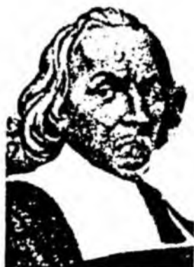
William Garvey (1578—1657).

Villiam Garvey tibbiyot kasbini egallashni tanladi. Shu maqsadda Paduya Universitetiga o'qishga kirdi. Bu o'quv yurti o'sha vaqtda Ovrupodagi eng ilg'or dorilfununlardan biri edi. Bu yerda Garvey anatomiya fani bilan qiziqib qolib, bu fan bilan ko'p shug'ullandi. 1602-yilda Garvey tibbiyot doktori darajasini olgan edi.