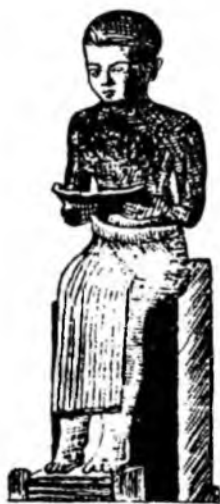
Imxotep — qadimgi misrliklar tabobat xudosi.

Qadimgi misrliklarning tibga oid kitoblaridan bizga eng ma'lumi Gearg Ebers papirusidir. Bu kitobda o'sha vaqtda ma'lum bo'lgan kasalliklar va ularni davolash usullari bayon etilgan. Xususan, kishi tanasining har bir a'zosida uchraydigan kasalliklar va shu kasalliklarda ishlatiladigan dorilar ko'rsatilgan. Kitobda ayollarda uchraydigan kasalliklarga alohida o'rin berilgan. Homiladorlik, uning dastlabki belgilari ko'rsatib o'tilgan. Misr amaliy tibbiyotida jarrohiyaga ham alohida o'rin berilgan. Xususan, har bir a'zoning jarohatlanishi, uning belgilari va davolash usullari ko'rsatilgan. Shu yerda xatna qilish usuli haqida ham so'z yuritiladi.