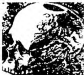
Trepanatsiya qilingan bosh suyagi.

qilib, biz hozir yeydigan kabobni o'sha neoantroplar kashf etganlar desak xato bo'lmas. O'z-o'zidan ma'lumki, pishgan go'sht oshqozon va ichaklarga qattiq botmaydi va oson hazm bo'ladi. Shuning uchun odamlar pishgan go'sht yeya boshlaganlaridan so'ng oshqozon-ichak kasalliklari bilan kamroq og'riqanlar. O'sha vaqtda neoantroplar sopol idish yasash usulini ham kashf etdilar. Bu ham kishilarga juda qulaylik keltirdi, ular ovqat mahsulotlarini (go'sht, o'simliklar va h.k.) qaynatib yeyish imkoniyatiga ega bo'ldilar. Bu ham kishilarning sog'lig'iga ijobiy ta'sir ko'rsatdi. Nihoyat neoantroplar shifobaxsh o'simliklarni sopol idishda qaynatib, ulardan qaynatmalar va damlamalar tayyorlashni bilib oldilar.