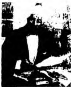
Abu Bakr Roziy (865—925).

o'ziga o'zi bunday deydi: "Men oltin topaman, deb 1 kecha-kunduz laboratoriyadan chiqmay ko'zimdan ajralayozdim. Bu kahhol esa arzimagan kasalni tuzatish uchun shu qadar ko'p pul oldi. Yaxshisi men ham tabib bo'la qolay deb, tibbiyotga oid kitoblarni o'qiy boshlabdi.