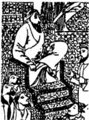
Ibn Sino talabalar bilan dars o'tmoqda.

tibbiy fikrlari haqida so'z yuritishni shu kitobni tahlil qilishdan boshladik.