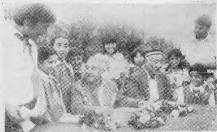
Ватан қаҳрамони М. Фаёзов ва Чустий домла ўқувчилар билан

Чустимиздаги мактабларда таҳсил олганлардан кўпчиликлари ҳозирги кунда йирик олим, мутахассислар бўлиб, турли соҳаларда ишлаб келинмоқда. Буюк тожик ёзувчиси Сотим Улугзода болалар шоири Зафар Диёр, ёзувчи Йўлдош Шамшаров, М. Нажмиддинов, ғазалнавис шоир Набиҳон Хўжаев (Чустий), Ўзбекистонда хизмат кўрсатган артист Эргаш Йўлдошев ва бошқалар шулар жумласидандир. Шу ўринда Чустий, И. Шамшаров ва М. Нажмиддинов фаолиятлари билан таништириб ўтамиз.