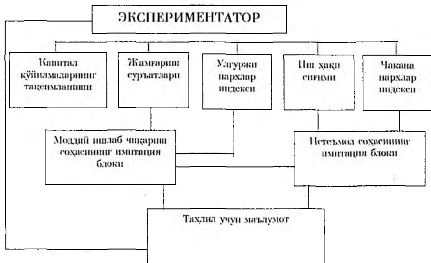
2-расм. Имитацион моделнинг структуравий схемаси

Шундай қилиб, инсон-машина имитацион системаси аҳоли пул даромадлари ва таклиф қилинаётган товар ва хизматлар орасидаги энг яхши нисбатни таъминловчи прогноз вариантларини топишга имкон беради. Бошқарув параметрларини ажратиш, оралиқ қарорларни баҳолаш ва якуний қарорларни танлаш экспериментаторга юкланади, мумкин бўлган кўпчилик ечим вариантлари ЭХМда ечилади.