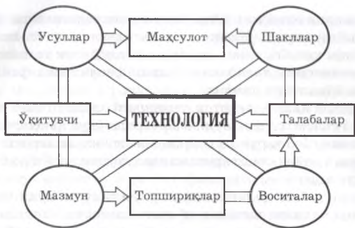
1-расм. Ўқитиш технологияси тузилмаси

Ўқитиш технологияси (жараён сифатида) - педагогик муолажалар, амал ва усуллар кетма-кетлиги (қатъий тартиб шарт эмас) бўлиб, яхлит дидактик тизимни ташкил этади, у педагогик амалиётга жорий этилиши билан кафолатли ўқув мақсадига эришилади ва талаба шахсининг тўлиқ ривожланишига имкон яратади. Технологияни ташкил этадиган муолажалар, амал ва усулларни муайян педагогик натижага эришиш йўлини батафсил ёритадиган алгоритм сифатида талқин қилиш ярамайди. Уларга яхлит тарзда таълим субъектларининг берилган мақсадларга ҳаракатланишини таъминловчи таянч дидактик воситалар сифатида қараш мақсадга мувофиқдир.