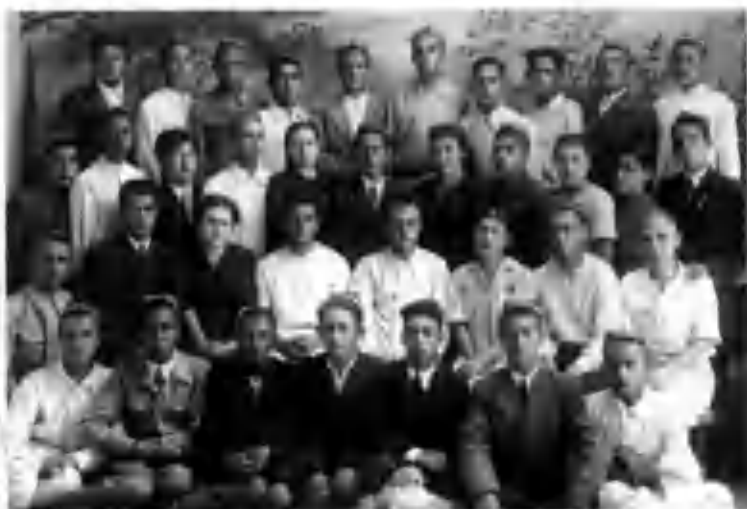
Курсдошлар ва устозлар даврасида. Самарқанд. 1947 й.