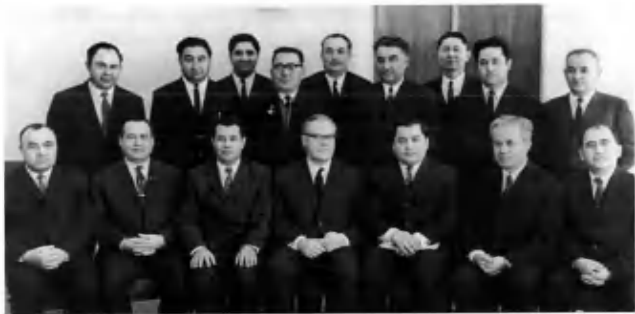
Шермухаммедов Саид Шермухаммедович, Мўминов Иброҳим Солиевич, Раҳмонов Насриддин Раҳмонович, Қодиров Эминжон Қодировичлар Қорақалпоғистон Республикаси Халқ маорифи вазири, вилоят ва Тошкент шаҳар халқ маорифи бўлимларининг мудирлари билан.