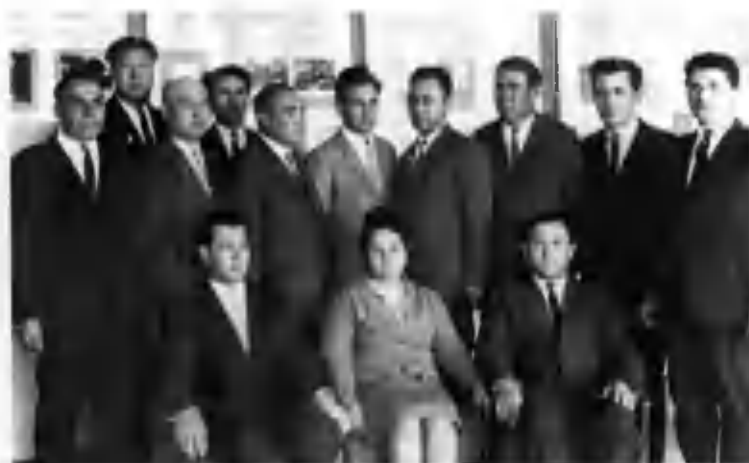
Қорақалпоғистон Автоном Республикаси, вилоятлар ва Тошкент шаҳар ўқитувчилар малакасини ошириш институтининг директорлари билан.