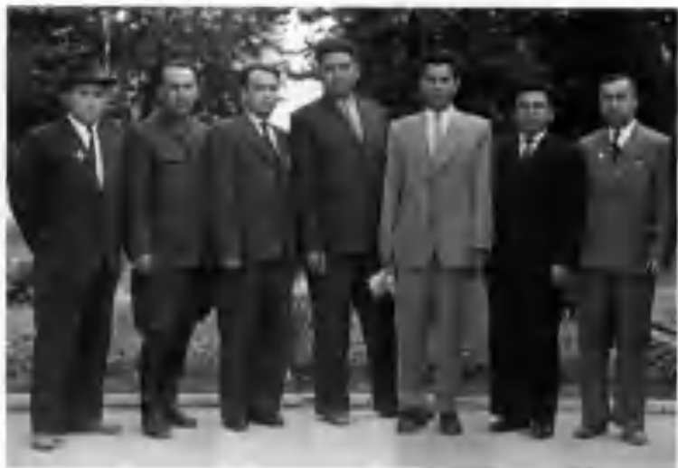
Самарқанд вилояти халқ маорифи ходимлари даврасида.