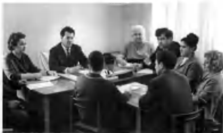
Республика ўқитувчилар малакасини ошириш ва қайта тайёрлаш Марказий институти илмий-услубий кенгашининг аъзолари билан.