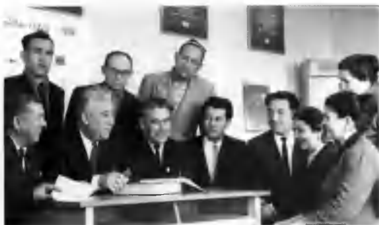
Ўзбекистон халқ шоири Уйғун ва Ўзбекистон халқ ёзувчиси Назир Сафаров Ўқитувчилар малакасини ошириш ва қайта тайёрлаш Марказий институтининг ходимлари даврасида.