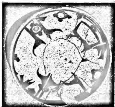
Бу лаганда (X—XI асрлар) эса араб зувининг кувий турида «Олиҳимматлик калити илмдир», деб ёзилган

идишлар хона тоқчасини безаш билан бир қаторда ўзига хос шиор вазифасини ҳам ўтаган. Ўша даврларда халқ донишмандлари ўз фикрларини тарғиб қилишда бундай усуллардан ҳам фойдаланишган. Кулолларимиз оммани эзгуликка ундовчи, илмнинг кадр-қимматини акс эттирувчи шиорларни омма орасида ёйишга муваффақ бўлганлар.