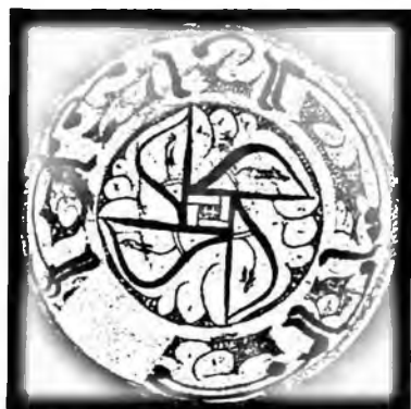
Афросиёбдан топилган лаганчага (X—XI асрлар) араб ёзувининг насх турида «илм олишнинг аввали аччиқ ниҳояси шириндир», деб ёзилган. Бойлик—бойлик эмас қачонки у сахий инсонда бўлмаса

Тошкентда ҳам археологик қазилмалар натижасида қадимда ишланган коса топилган бўлиб, косанинг ички қисмида ислимий нақш заминида ҳумо қуши бадийий образи тасвирланган. Бу билан кулол санъаткор ўз фикрини бадийий образ орқали фоний дунёда инсонларга тинчлик, яхшилик, бахт-саодат, фаровонлик йўлидаги орзу-умидларига эришишларини ифодалаган.