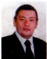
Ғ. РАҲИМОВ ижроқўм аъзоси, Осиё олимпия қўмитаси вице- президенти