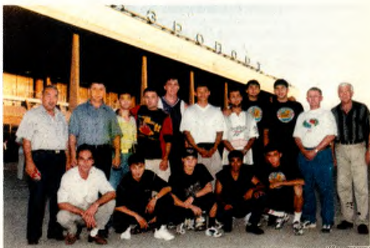
Ғалабаларга парвоз шу жойдан бошланади