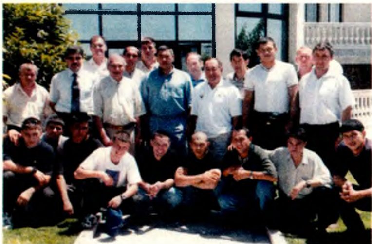
Олимпиячиларимиз Республика бокс федерацияси раҳбарлари ва мураббийлари билан