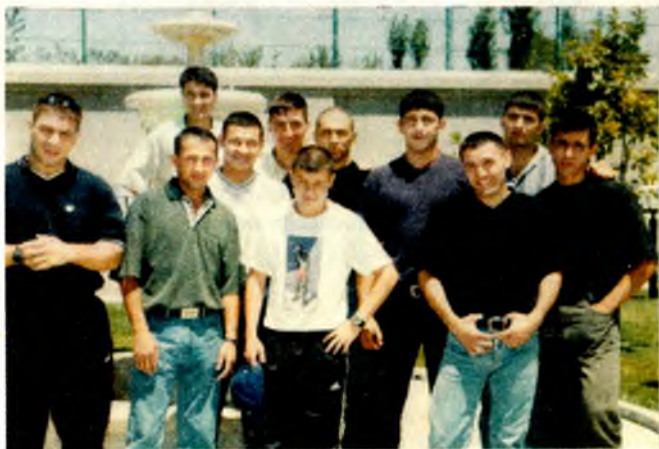
Кўтаринки кайфият ютуқлар гарови