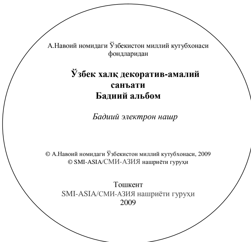
А.2.2-расм. Элтувчи ёрлиғи