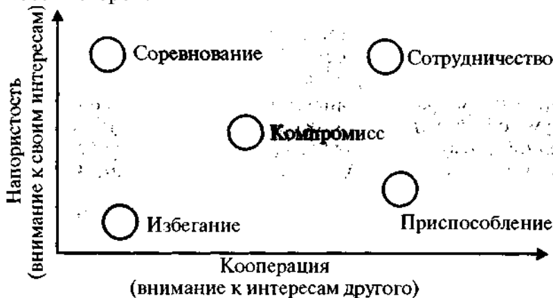
Пять способов регулирования конфликтов К. Томаса

К. Томас считает, что при избегании конфликта ни одна из сторон не достигает успеха; при таких формах поведения, как конкуренция, приспособление и компромисс, или один из участников оказывается в выигрыше, а другой проигрывает, или оба проигрывают, т. к. идут на компромиссные уступки. И только в ситуации сотрудничества обе стороны оказываются в выигрыше.