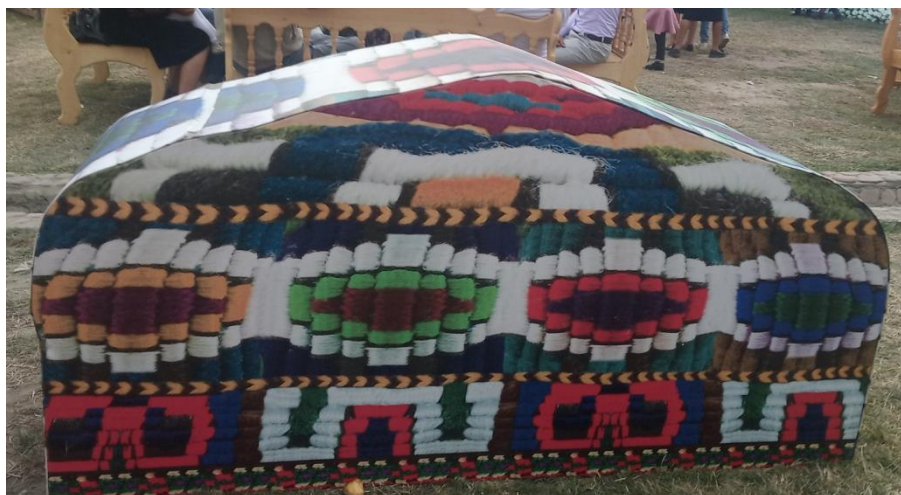
Рис. 4. Изделие в технике лоскутной мозаики. Часть экспозиции Сурхандарьинской обл. Первый Международный фестиваль народно-прикладного искусства, г. Коканд, сентябрь 2019 г.

У таджиков молодые женщины изготавливают из лоскутов даже платья. Такие изделия в технике «курок», т.е. сшитые из небольших лоскутков ткани в виде треугольника, квадратиков, ромбов и других фигур, играли роль оберега 1 .