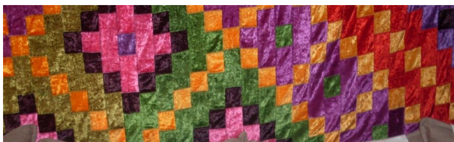
Рис. 8-9. Фрагмент и изнаночная часть панно

Судя по размерам, ткань для него подбиралась не из остатков, а большим метражом, и только потом была разделена на сегменты. Фактура ткани велюр, что предполагает особое мастерство при соединении мозаики.