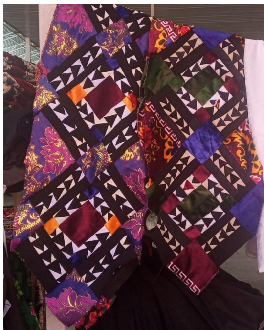
Рис. 3. Наволочки. Изделия, резуемые на базаре, г. Коканд