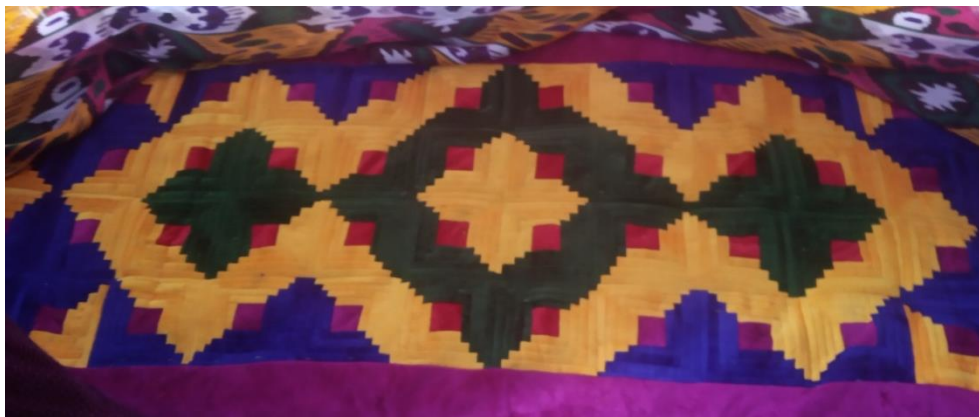
Рис. 1. Оформление юрты. Каракалпакия. Первый Международный фестиваль народно-прикладного искусства, г. Коканд, сентябрь 2019 г.

Данный вид изделий декорирует постельные принадлежности.