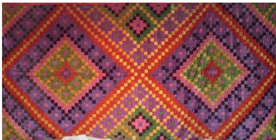
Рис. 7. Общий вид панно

Это огромное панно размером 4м.44см.×2м.20см., размер лоскута 5см.×5см. С изнаночной стороны дублировано грубой холщовой тканью и сатином.