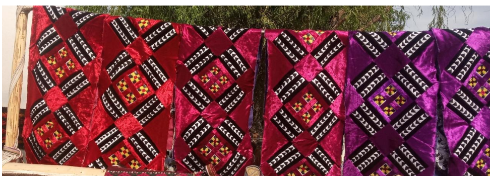
Рис. 2. Наволочки. Часть экспозиции. Первый Международный фестиваль народно-прикладного искусства, г. Коканд, сентябрь 2019 г.

Данный вид изделий декорирует постельные принадлежности.