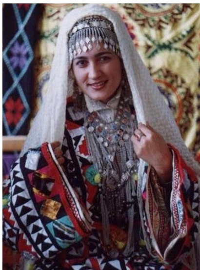
Рис. 5. Платье в лоскутной технике

У таджиков молодые женщины изготавливают из лоскутов даже платья. Такие изделия в технике «курок», т.е. сшитые из небольших лоскутков ткани в виде треугольника, квадратиков, ромбов и других фигур, играли роль оберега 1 .