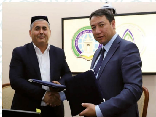
Imom Buxoriy nomi bilan atalgan ikki ilm dargohi o'zaro hamkorlikni mustahkamladi.

Islom taraqqiyot banki prezidenti boshchiligidagi delegatsiya Imom Buxoriy xalqaro ilmiy-tadqiqot markazida bo'ldi.